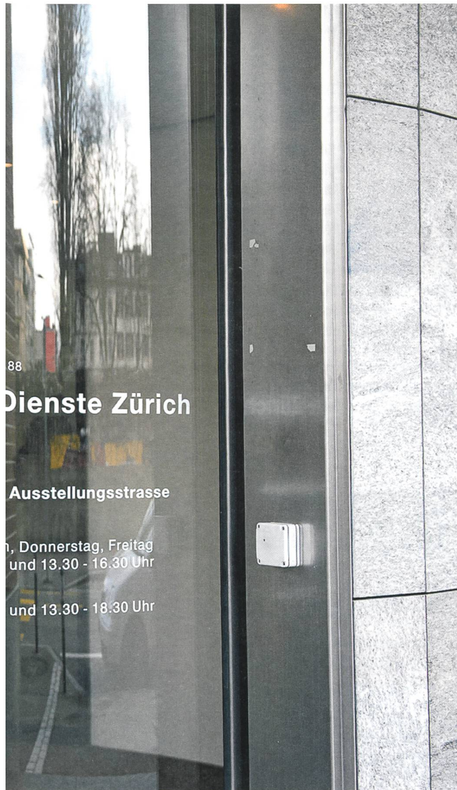
Mehr Menschen auf dem Weg ins Sozialamt.