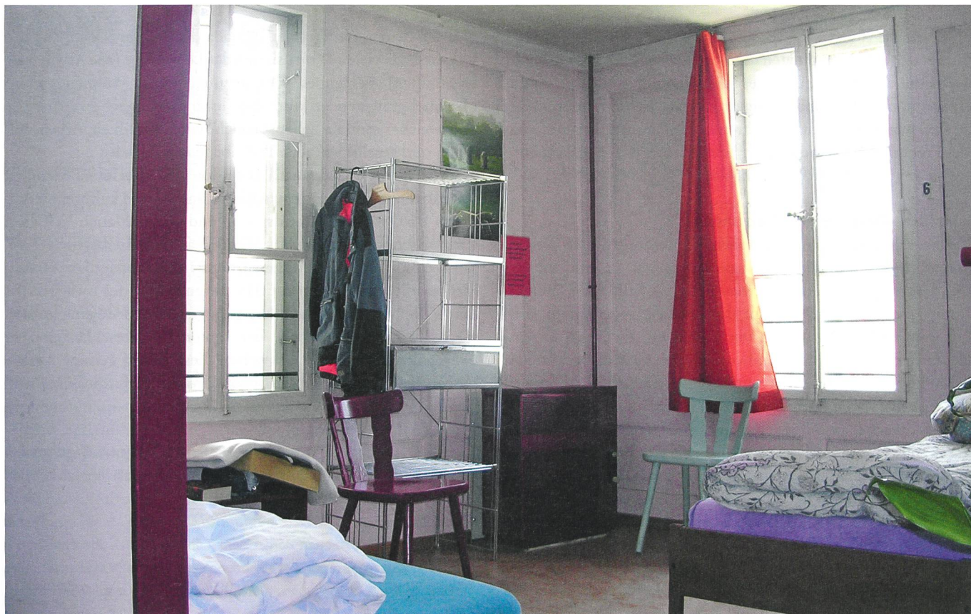
Obdachlos: Manche schlafen draussen, andere in Notunterkünften oder bei Freunden.