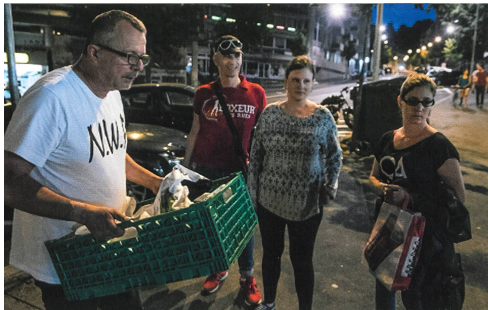
Hilfe für Obdachlose: Die freiwilligen Helfer von Marade in Lausanne.

Haute école de travail social et de la santé de Lausanne