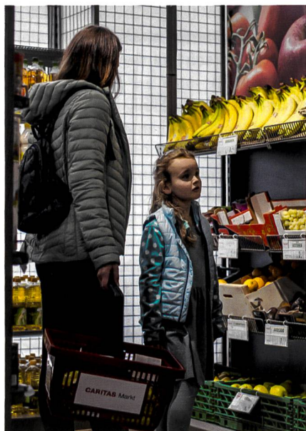
Viele Haushalte leben nur knapp über der Armutsgrenze.

Knapp 9 Prozent der Baselbieter Bevölkerung sind gemäss Zahlen aus dem Jahr 2017 von Armut betroffen – rund 15 Prozent sind armutsgefährdet. Es gebe keine Hinweise darauf, dass die Armut im Kanton Basel-Landschaft zurückgegangen sei, vielmehr habe sie eher zugenommen, sagte Jörg Dittmann von der Hochschule für Soziale Arbeit der FHNW, der den Armutsbericht im Auftrag des Kantons Basel-Landschaft verfasst hat. (ih)