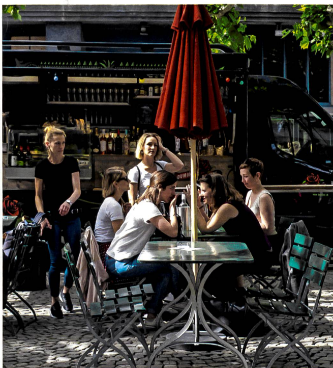
Investition in soziale Integration lohnt sich.