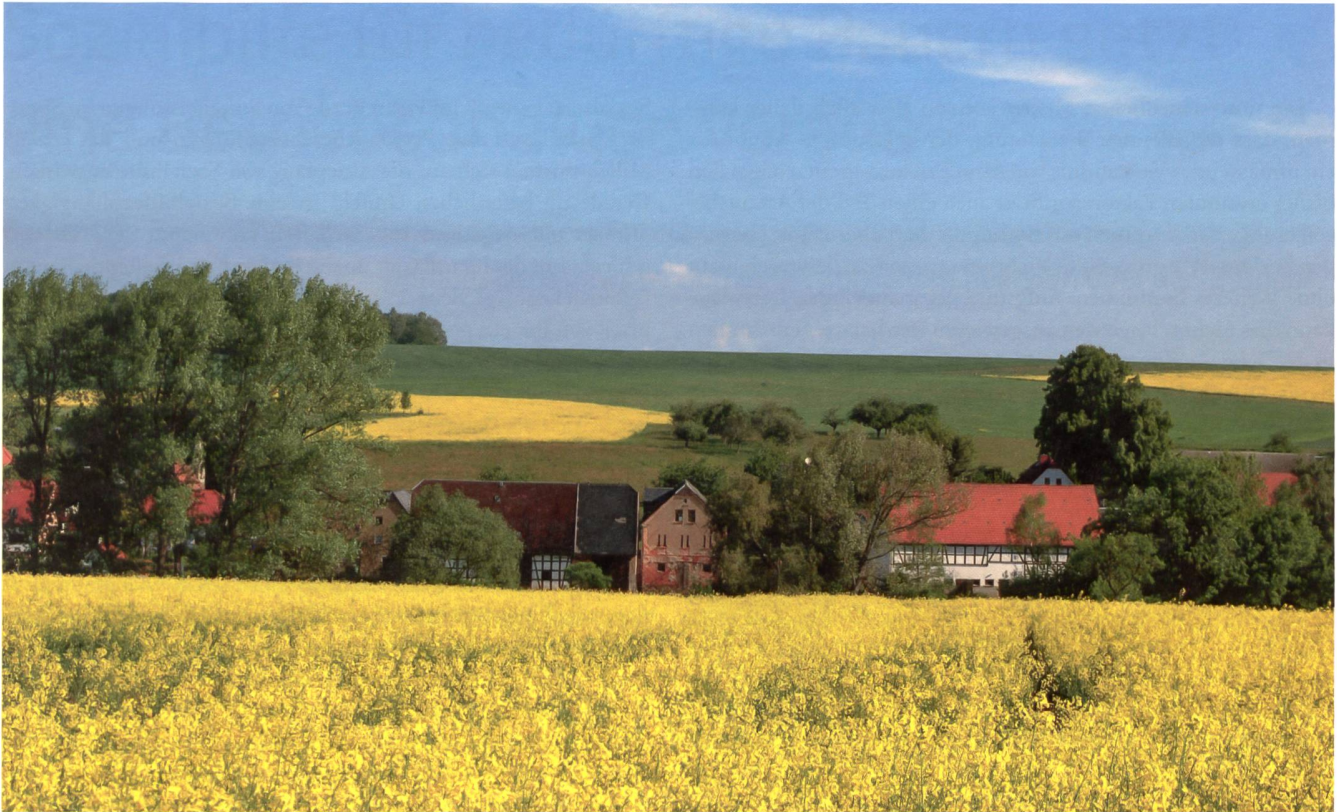
Tiefe Sozialhilfequote trotz tiefem Durchschnittseinkommen ist in ländlichen Gemeinden kein Widerspruch.