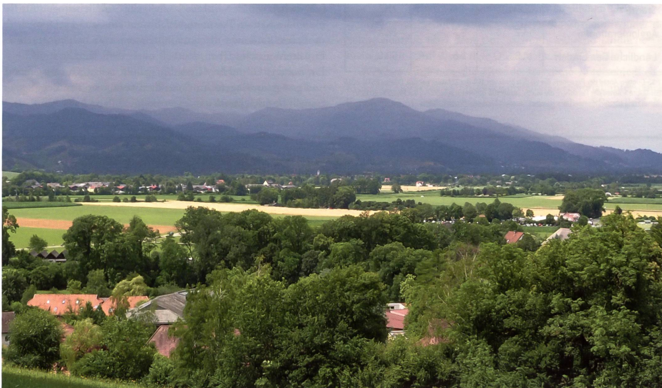
In der dörflichen Gemeinschaft funktioniert die gegenseitige Unterstützung häufig noch.