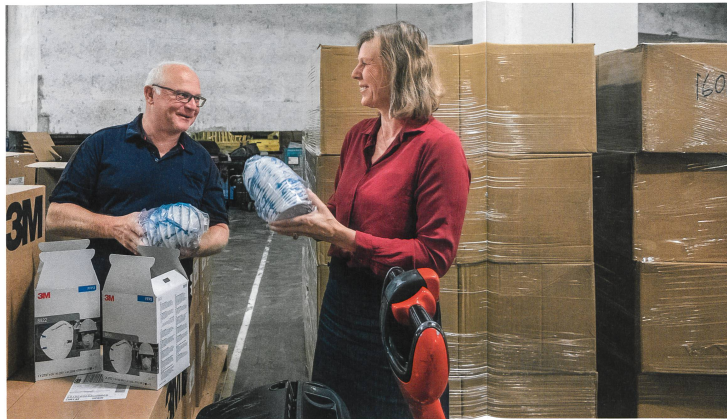
Das SRK konnte dank guter Beziehungen Millionen von Schutzmasken importieren, die dann via Grossverteiler der Bevölkerung zur Verfügung stehen.

Das Gespräch führte am 29.4.2020 Ingrid Hess