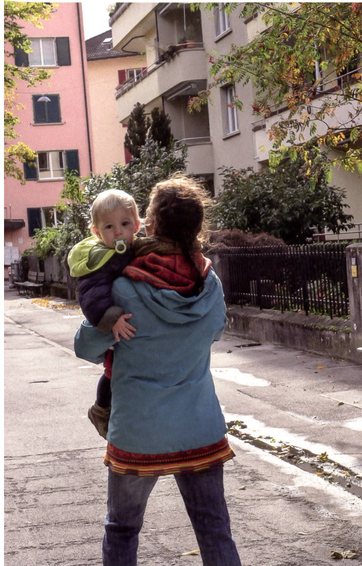
Die Stadt Winterthur informiert offen und transparent über unrechtmässigen Bezug, um die Mehrheit der rechtmässig Sozialhilfebeziehenden zu schützen.