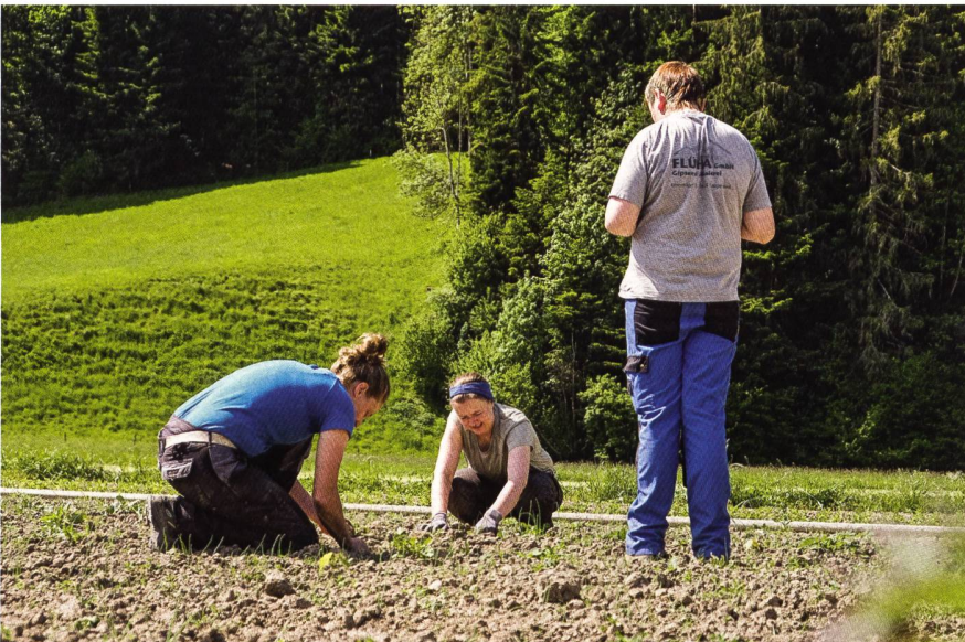
Der Alltag im landwirtschaftlichen Betrieb der Stiftung Lebensart ist nach 20 Jahren im Berufsleben eine ganz neue Erfahrung.