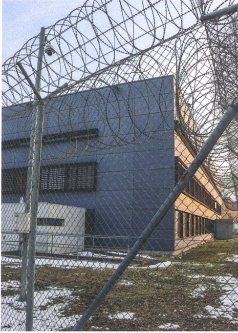
Das Untersuchungsgefängnis in Thun liegt eingepfercht zwischen der Allmendstrasse und den Bahngleisen gegenüber der grossen Militärkaserne im Westen der Stadt.