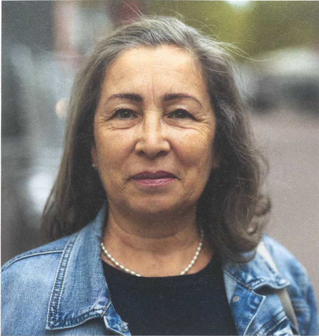
Schwierige Stellensuche für 50plus trotz Fachkräftemangel.

Die Projektleitung des VSAA (Verband Schweizerischer Arbeitsmarktbehörden) bietet regelmässig Updates, Klärungen und Austausch mit involvierten Angeboten aus anderen Kantonen an.