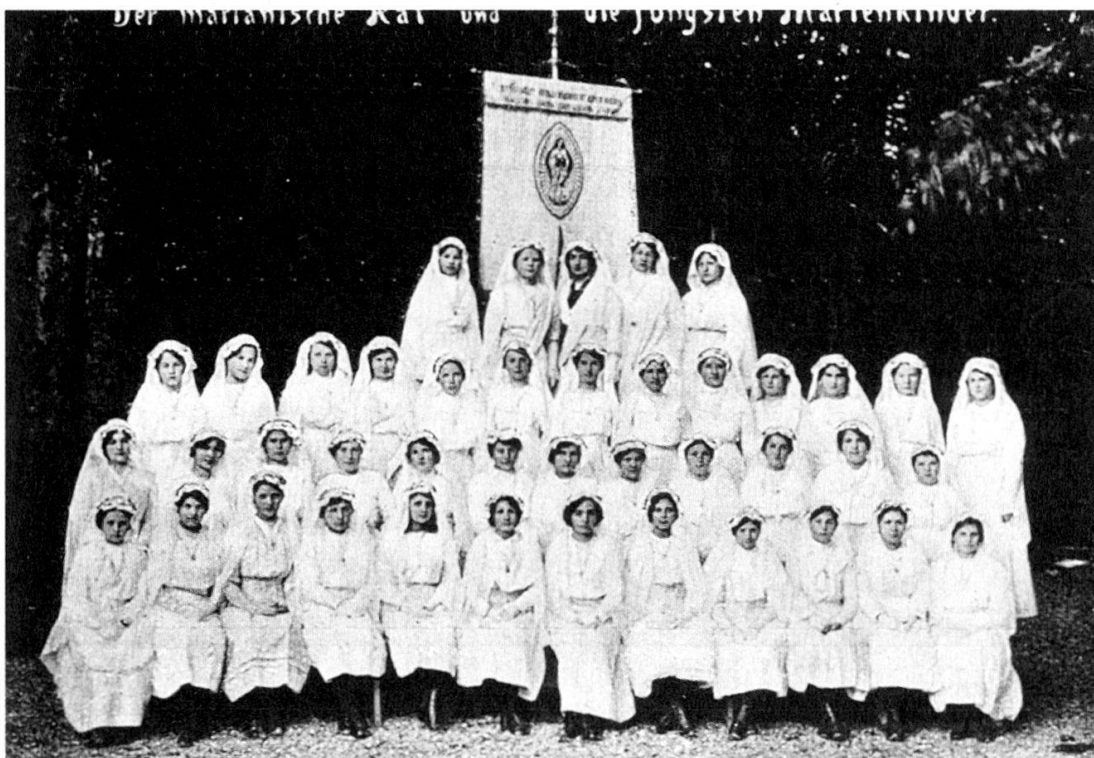
«Der marianische Rat und die jüngsten Marienkinder», Theresianum-Glöcklein , 7,3 (1914), 66.

Es muss auffallen, wenn die offizielle und einzige Institutszeitschrift für ehemalige wie aktive Schülerinnen ihre Inhalte dem Ideal der Marienfigur weihte. Es scheint, als wären die Schülerinnen auch «Marienkinder» und somit identisch mit den Mitgliedern der Marianischen Kongregation des Instituts gewesen, obwohl für die Schülerinnen kein Beitrittszwang zur Marianischen Kongregation bestand. 4