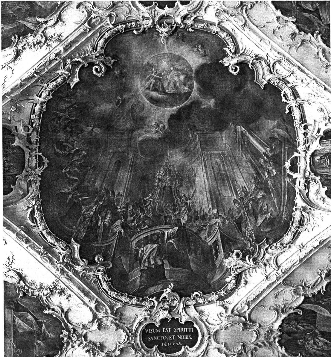
Abb. 2: Stiftsbibliothek St. Gallen, Deckengemälde: das Konzil von Konstantinopel (381), geschaffen 1762/63 von Joseph Wannenmacher.

Unter rotem Baldachin links aussen thront Bischof Gregor von Nazianz. Auf ihn als bedeutenden Verfechter der Gottheit des Heiligen Geistes fällt der Gnadenstrahl der Geisttaube. Ihm vorgelagert sind zwei weitere kirchliche Würdenträger zu sehen, wahrscheinlich handelt es sich um Meletios von Antiochien, den ersten Konzilsvorsitzenden, und um dessen Nachfolger in Antiochien Flabius. Die häretische Partei auf der rechten Seite wird von Makedonios von Konstantinopel angeführt. Auf ihn fällt der Blitzstrahl der Geisttaube und lässt seine Brust aufflammen, und im Unterschied zu den drei rechtgläubigen Würdenträgern auf der anderen Seite fehlt auf seiner Krone das Kreuz.