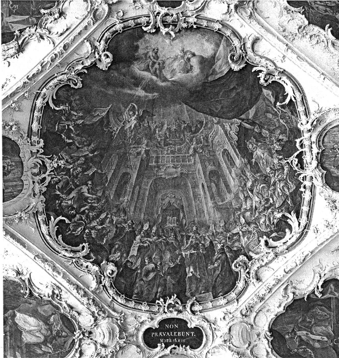
Abb. 1: Stiftsbibliothek St. Gallen, Deckengemälde: das Konzil von Nicäa (325), geschaffen 1762 von Joseph Wannenmacher.

einem Kohlebecken auf dem Dreifuss und weist Arius (mit schwarzem Birett) in die Verbannung.