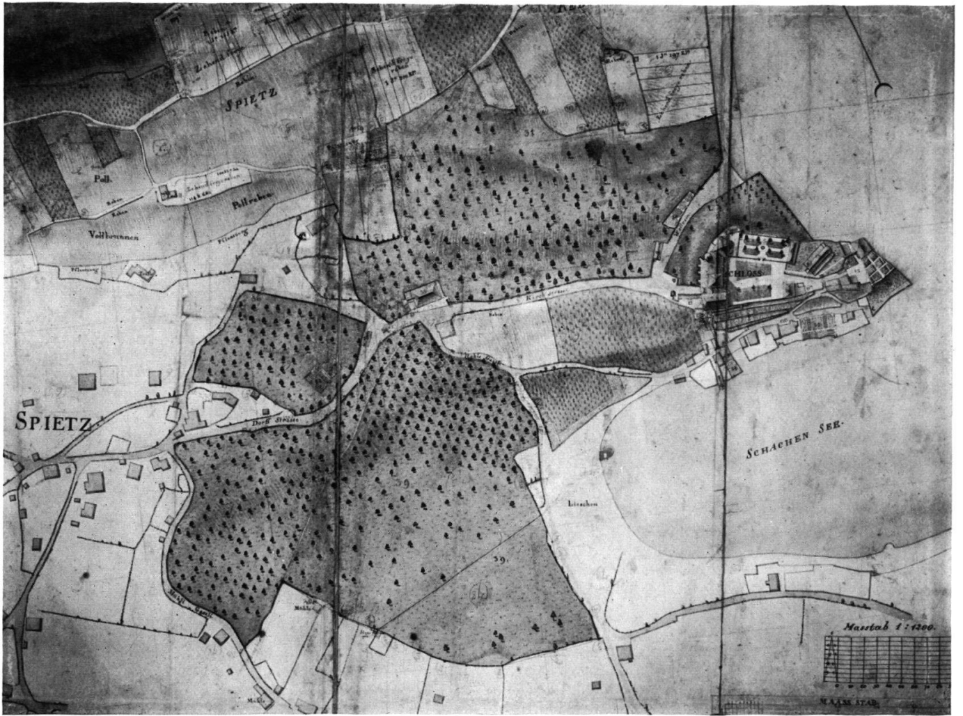
Plan von Spiez 1793/95.