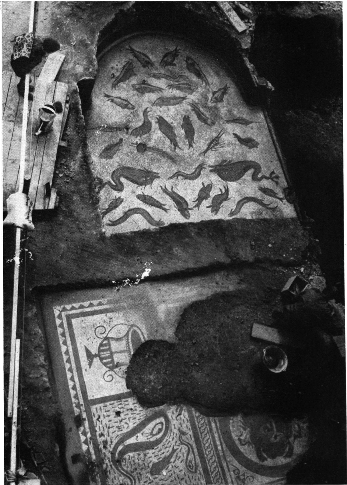
Gesamtansicht des Mosaikfundes.