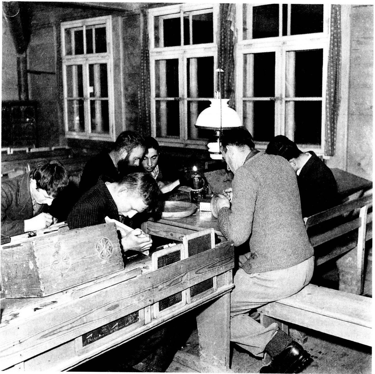
Schnitzkurs von 1945 in Ried (Gemeinde Frutigen).