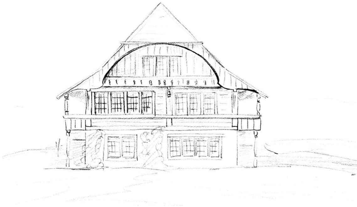
Bild oben: Bern, Riedbach, Wohnhaus von 1949: Plan (Südansicht) von Baumeister Rüedi für den Neubau des Wohnhauses; 1949.

Bild unten: Bleistiftskizze als Verbesserungsvorschlag von Christian Rubi (wohl von 1949) zum Projekt Riedbach.