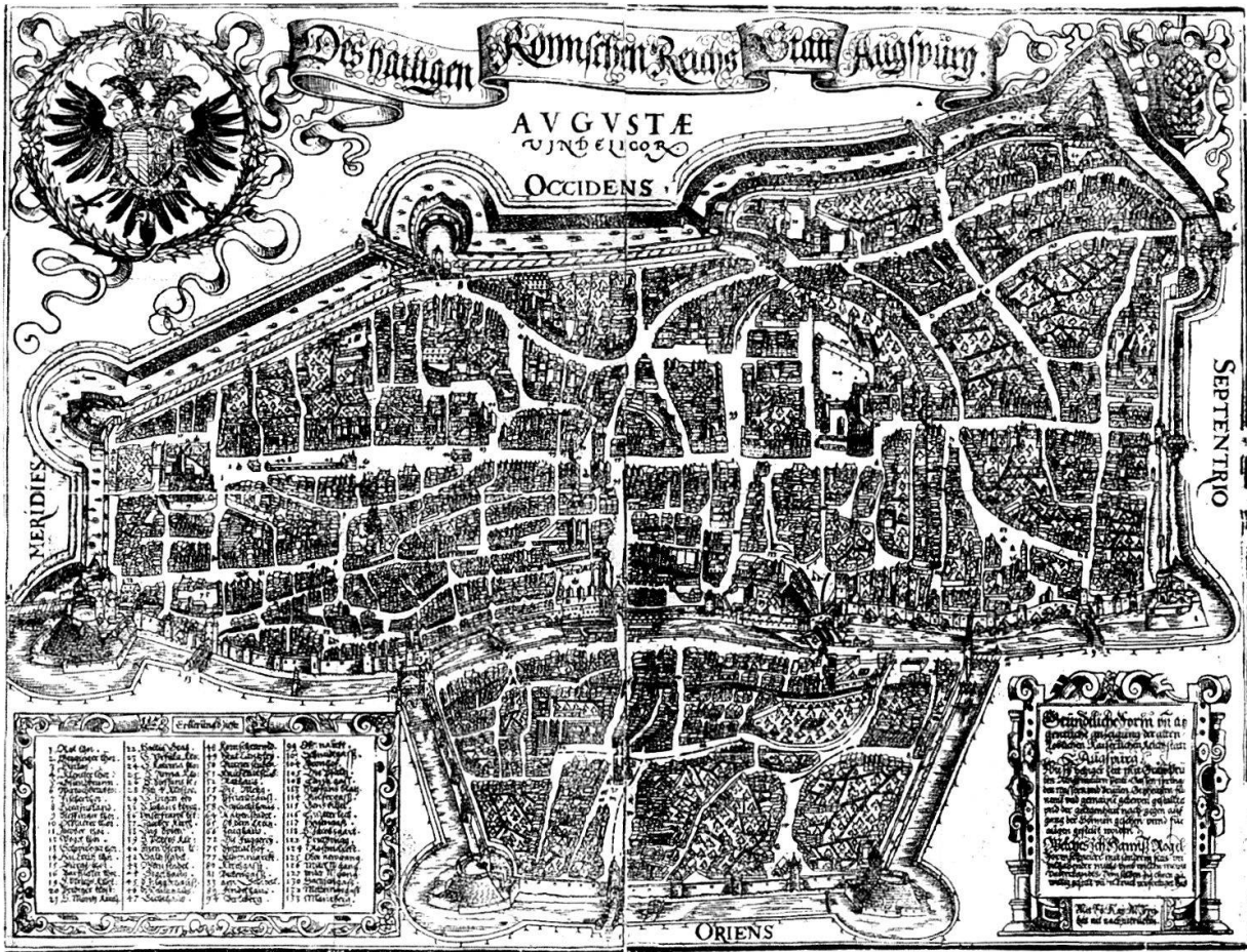
Stadtansicht von Augsburg um 1521 in der Darstellung des Jörg Seld. Holzschnitt (Augsburg, Staats- und Stadtbibliothek).

Erstaunlicher ist diese Zielgerichtetheit in den drei verbleibenden Fällen; sie kann aber mit grosser Sicherheit belegt werden.