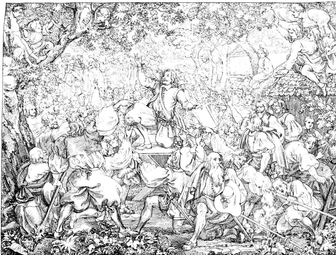
Der Bundesschwur in Huttwil.

Abb. 1 «Der Bundesschwur in Huttwil» am 14. Mai 1653, Lithografie von Martin Disteli von 1840. Im Mittelpunkt dieser Landsgemeinde kniet Niklaus Leuenberger, der in der linken Hand den Bundesbrief hält und den rechten Arm zum Schwur gegen den Himmel streckt. Sein Blick nach oben verweist darauf, dass die Bauern einen Kniefall vor Gott vollzogen und nicht vor der Obrigkeit, wie es sich eigentlich für Untertanen geziemte. Der liberale Karikaturist Disteli stilisiert den Führer des Bauernkrieges zum Helden im Kampf gegen die Obrigkeit und im übertragenen Sinn gegen die Konservativen des 19. Jahrhunderts.