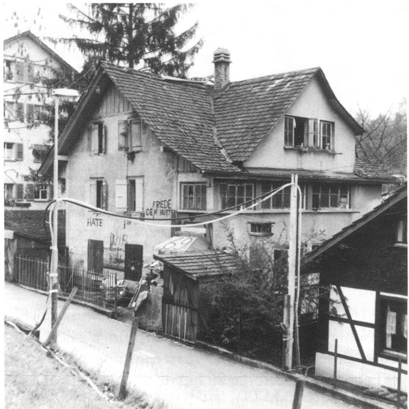
Jurastrasse 69: Situation vor dem Abbruch.

Das einfache, giebelständig zur Strasse stehende, zweigeschossige Wohn- und Gewerbehause JURASTRASSE 69 mit ausgebautem Dachgeschoss und «Cabinet für Gewerbe» im hangseitig freiliegenden Untergeschoss wurde 1864 durch den Zimmermeister Frédéric Winkelmann erbaut. Die Fassaden wurden nachträglich mit Holzschindeln verkleidet und 1927 erfuhr der nordseitige Erschliessungstrakt bauliche Veränderungen. Die Liegenschaft war ein wichtiger Bestandteil der Gebäudegruppe der hinteren Jurastrasse, einer zusammenhängenden Gruppe von ähnlichen, abwechselnd links und rechts die Jurastrasse säumenden, zur Erstbebauung der Lorraine gehörenden Häusern von ländlich-spätklassizistischem Habitus. Die Gebäudegruppe zeigt exemplarisch die Wohnverhältnisse einfacher Leute im letzten Drittel des 19. Jahrhunderts.