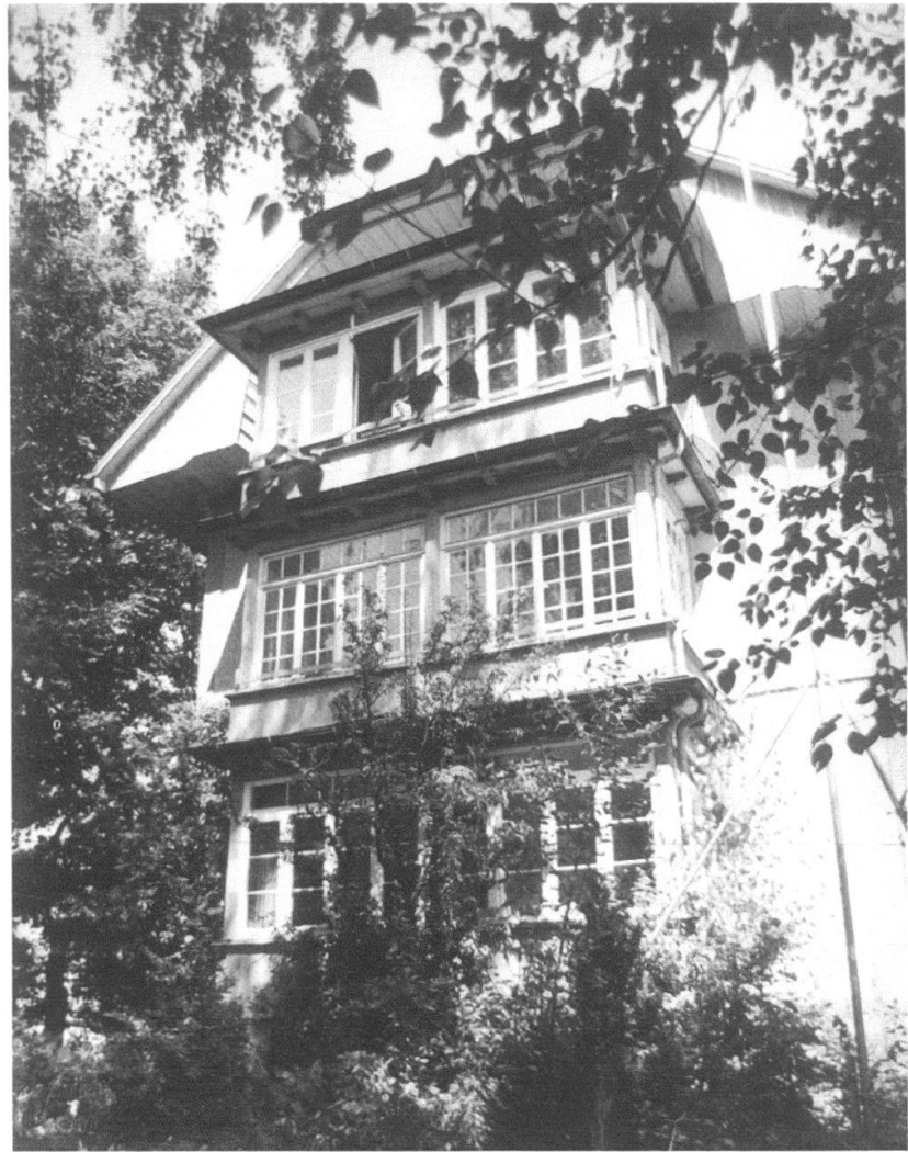
Stöckackerstrasse 98: Westfassade vor dem Abbruch 2004.

des Hauses im damals noch von ländlichen Bauten dominierten Stöckackerquartier erklärbar. In seiner Gesamterscheinung blieb das Gebäude während über 90 Jahren ohne bedeutende Veränderungen erhalten. Umbauten im Jahr 1955 für die sanitären Einrichtungen veränderten lediglich die Nordwestfassade. Mit dem 1960 erlassenen «Bebauungsplan Schwabgut» war der Abbruch des Baus seit geraumer Zeit sanktioniert. Dieses frühe «Todesurteil» konnte auch die Einstufung des architekturgeschichtlich wertvollen Objekts als «erhaltenswert» im Bauinventar Bümpliz nicht rückgängig machen. Nach langer Planungszeit wurde im Jahr 2003 ein den Planungsgrundlagen entsprechendes Bauprojekt genehmigt und das Gebäude im Februar 2004 abgebrochen. R.F.