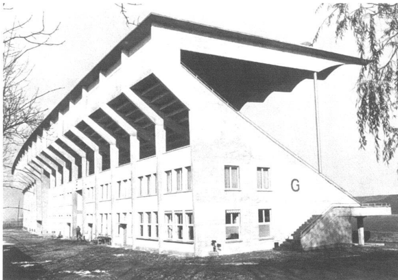
Stadion Wankdorf: Historische, nicht datierte Aufnahme der Tribüne.

über Ungarn 1954 machte den Namen Wankdorf in Deutschland zu einem Symbol für ein wiedergefundenes nationales Selbstbewusstsein, das seine Kraft bis heute nicht verloren zu haben scheint. Der absolut ungenügende Unterhalt der Bauten, welcher wohl auf die sich schon in den 1960er-Jahren abzeichnenden Neubauwünsche zurückzuführen war, führte zu der von der Presse bereitwillig verbreiteten, aber falschen Meinung, dass die Gebäude mit verhältnismässigem Aufwand nicht mehr zu halten gewesen seien. Angesichts des hohen öffentlichen Drucks widersetzte sich die Denkmalpflege dem Abbruch nicht – dies unter dem klaren Vorbehalt, das neue Gebäude sei in hoher architektonischer Qualität zu errichten. Mitte 1998 wurde ein Wettbewerb ausgeschrieben und im Mai 2001 schliesslich die Baubewilligung für das mehrfach überarbeitete Siegerprojekt erteilt. Das alte Stadion Wankdorf wurde im August 2001 abgebrochen.