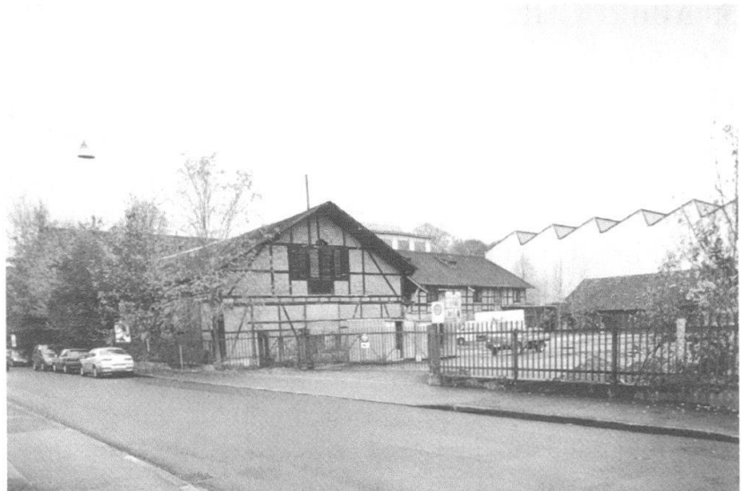
Von-Roll-Areal: Gesamtansicht der Schopf- und Remisebauten Fabrik- strasse 16 und 18 B.

für das Erhalten und Restaurieren des Altbaus in Relation zur wirtschaftlichen Ertragskraft. Im Vergleich zu früheren Berichtsperioden waren in den vergangenen vier Jahren nur wenige Verluste bedeutender Bauten zu verzeichnen.