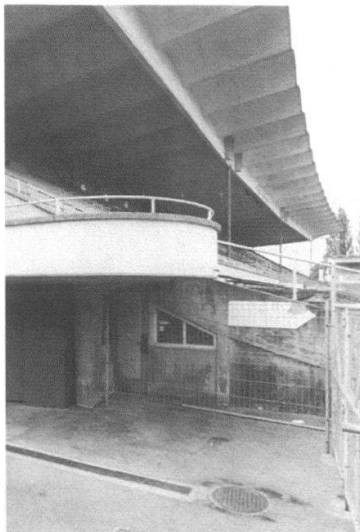
Stadion Wankdorf: Tribüne mit Balkon.