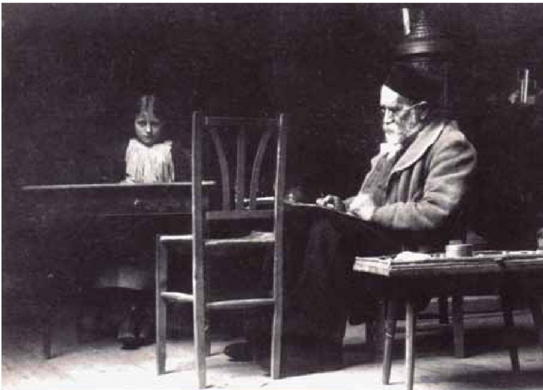
Albert Anker, mit altem Mann als Modell im Inser Atelier.