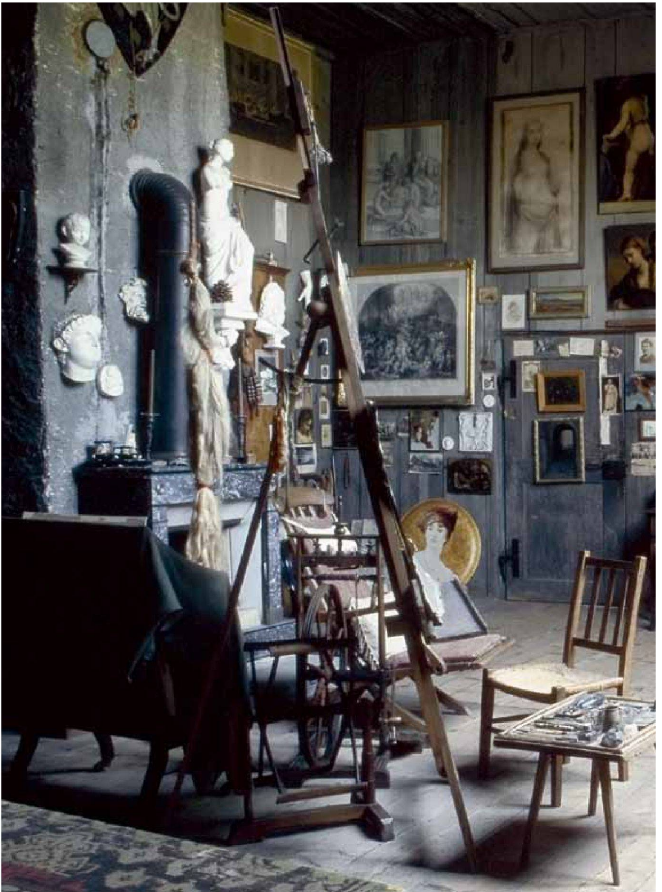
Anker-Atelier in Ins, Blick gegen Südosten.