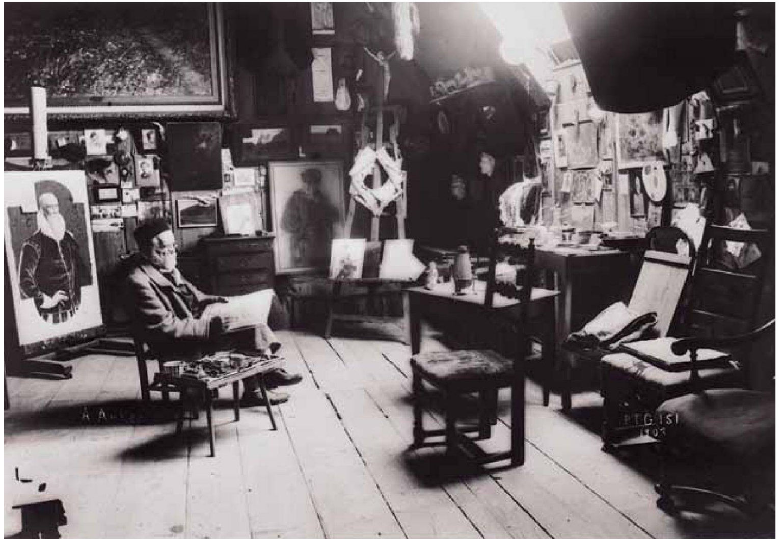
Anker-Atelier in Ins, Raumsicht Nordwest, 1907