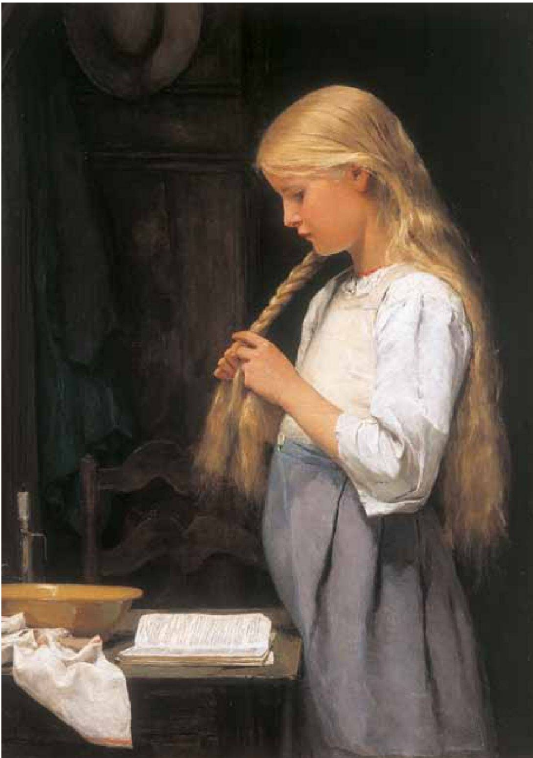
Albert Anker, Mädchen die Haare flechtend, 1887, Öl auf Leinwand, 70,5x54 cm, Kat. Nr. 378. – Stiftung für Kunst, Kultur und Geschichte, Winterthur.