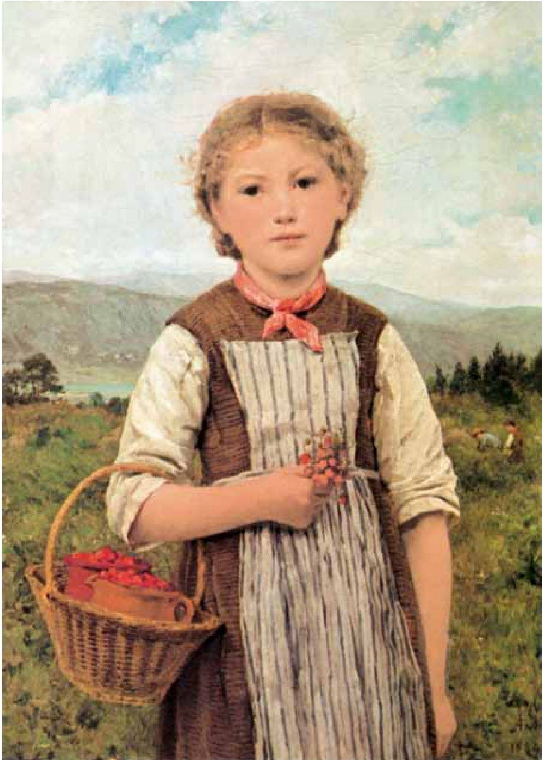
Albert Anker, Erdbeerimareilli, 1884, Öl auf Leinwand, 82 x 60 cm, Kat. Nr. 323. – Musée cantonal des Beaux-Arts, Lausanne.