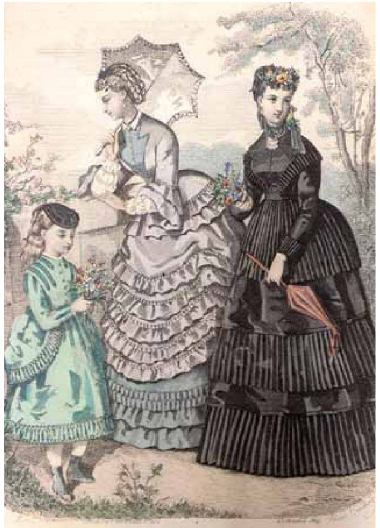
Magasin des Demoiselles, Journal mensuel, Laffitte Paris, 25. Oktober 1869, handkolorierte Grafik, 26 x 16,5 cm. – Privatbesitz.