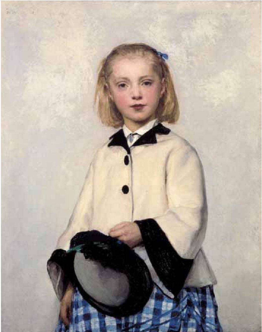
Bildnis Louise Anker, 1874, Öl auf Leinwand, 80,5x65 cm, Kat. Nr. 199. – Museum Oskar Reinhart am Stadtgarten, Winterthur.