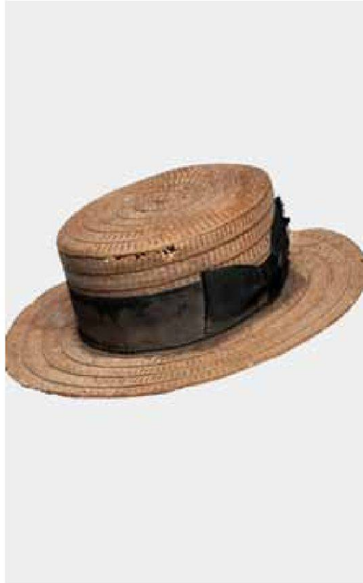
Albert Anker mit Strohhut. [Ausschnitt].

Strohhut mit hoher Kopfform und breiter Krempe. Schwarzes breites Zierband mit Schlaufe, Stempelinschrift: «CHAPELLERIE GEBR. SCHWAB INS-ANET». – Stiftung Albert Anker-Haus Ins.