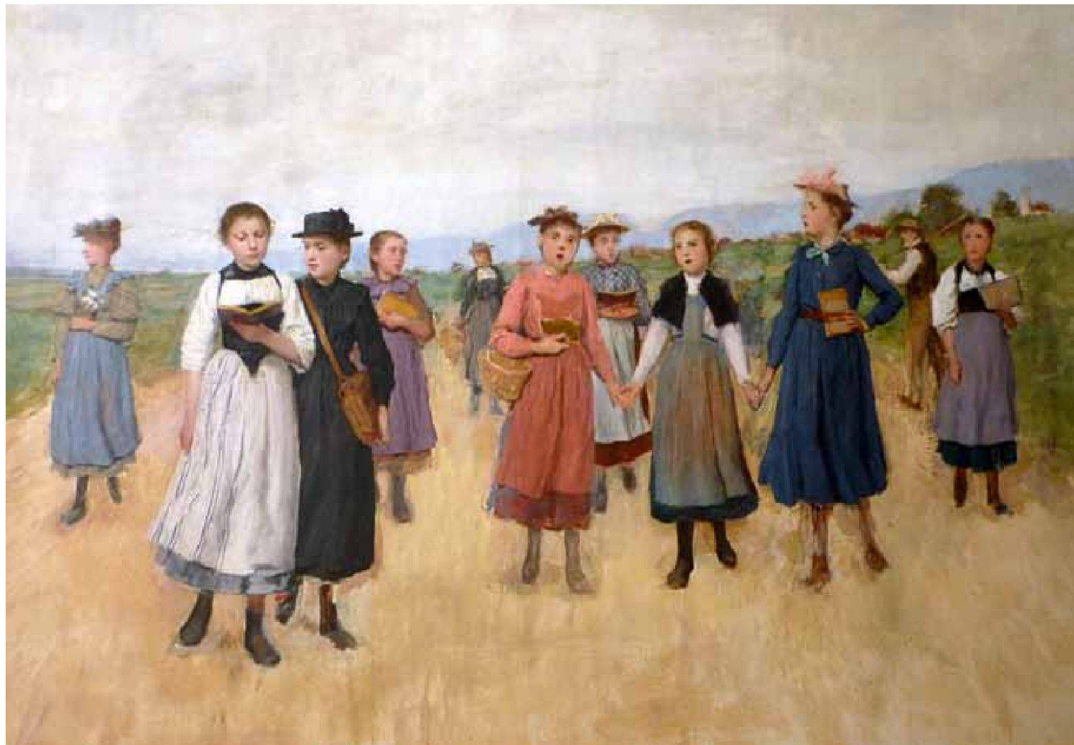
Albert Anker, Die Konfirmandinnen von Müntschemier, 1901, Öl auf Leinwand, 86 x 131 cm, Kat. Nr. 584. – Gemeinde Ins.