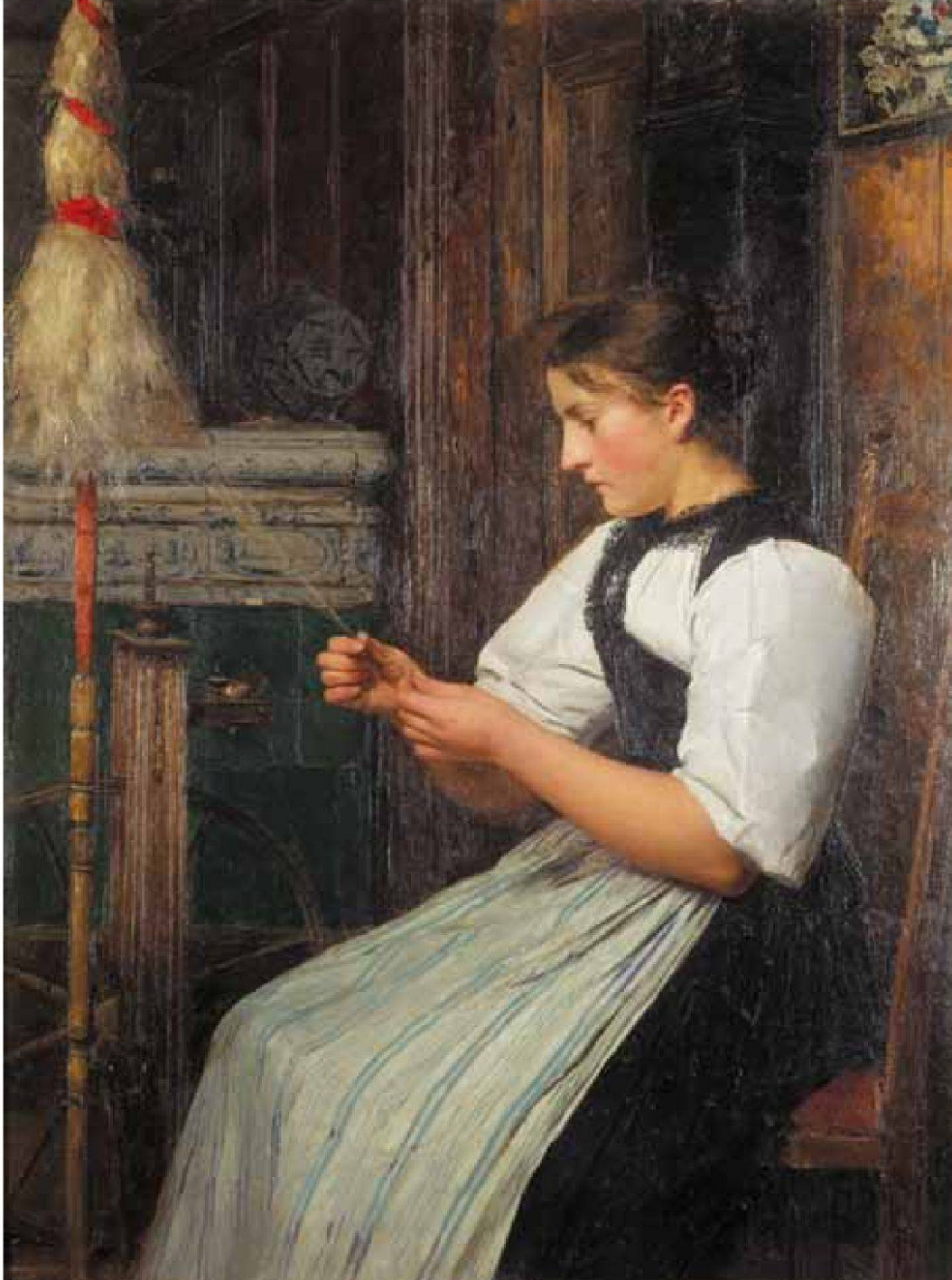
Albert Anker, Junge Frau am Spinnrad, 1884, Öl auf Leinwand, 70,5x53,5 cm. Kat. Nr. 321. – Privatbesitz.