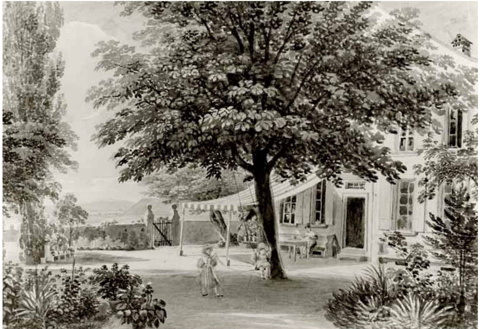
Lory, Gabriel. – Pfarrhaus Ins, Aquarell. – Burgerbibliothek Bern.