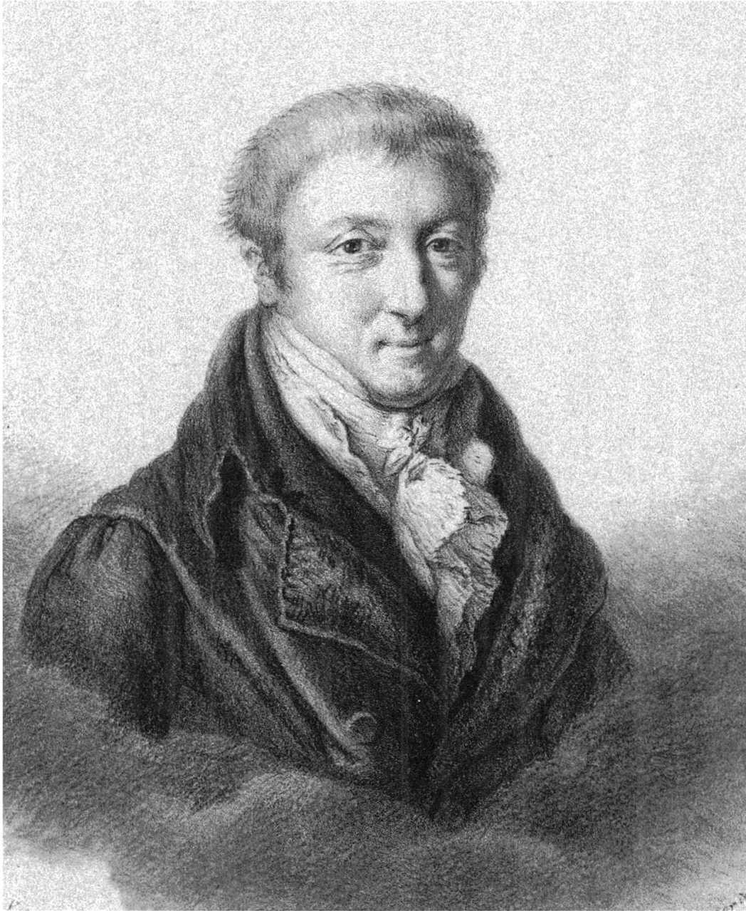
Carl Ludwig von Haller (1768–1854). – Lithographie. Burgerbibliothek Bern.