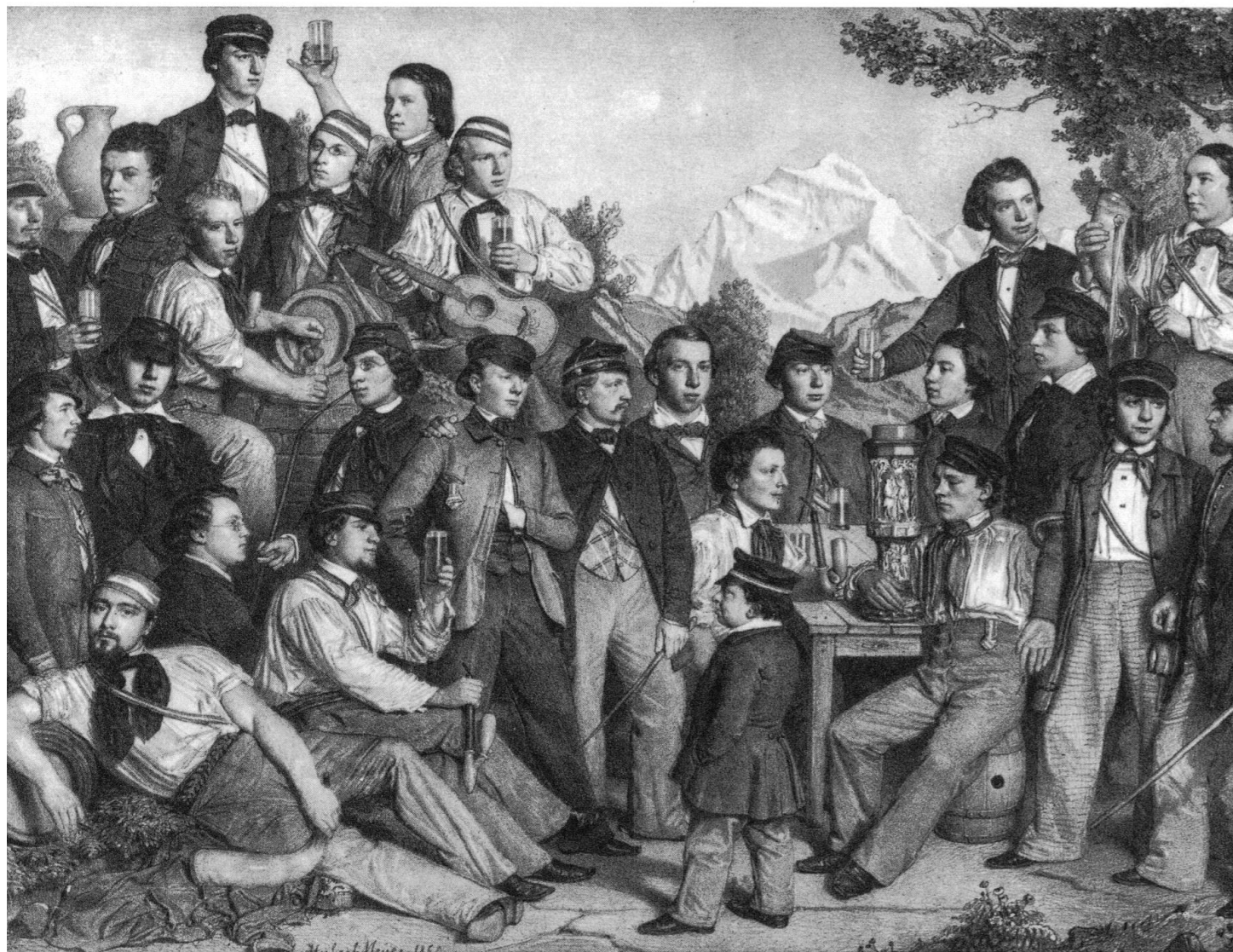
Die Helvetia Bern im Jahre 1850. Die Studentenverbindung entwickelte sich in den 1840er-Jahren zu einer Rekrutierungsbasis für die angehende politische Elite und diente der radikalen Bewegung als Kaderschmiede. Deshalb war später bisweilen die Rede vom Bundeshaus als «Curia Helvetorum» (Rathaus der Helveter) – eine Persiflage auf die offizielle Bezeichnung «Curia Confoederationis Helveticae» (Rathaus der Schweizerischen Eidgenossenschaft). – Lithografie von Hubert Meyer (geb. 1826).