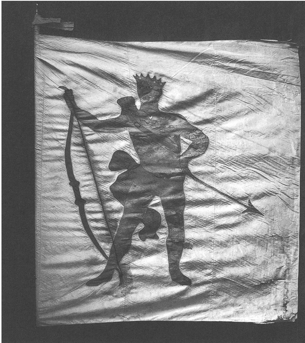
Stubenfahne der Zunft zum Mohren: Schwarzer König mit Krone, Bogen, Köcher, Pfeil und Lendentuch (16. Jahrhundert). – Bernisches Historisches Museum, Depositum (Inv. 8778.1).