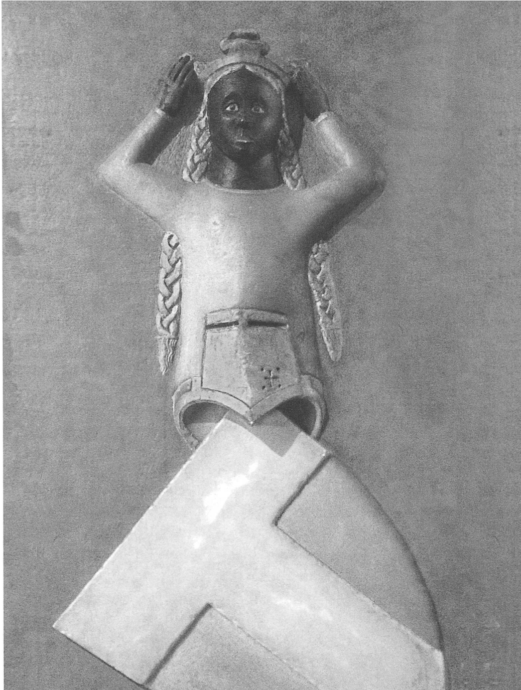
Ausschnitt aus der Grabtafel des Walther Senn von Münsingen in der Französischen Kirche: Kopf einer schwarzen Frau mit goldenen Haaren, Familienwappen mit weissem T-Balken auf rotem Grund (1323).