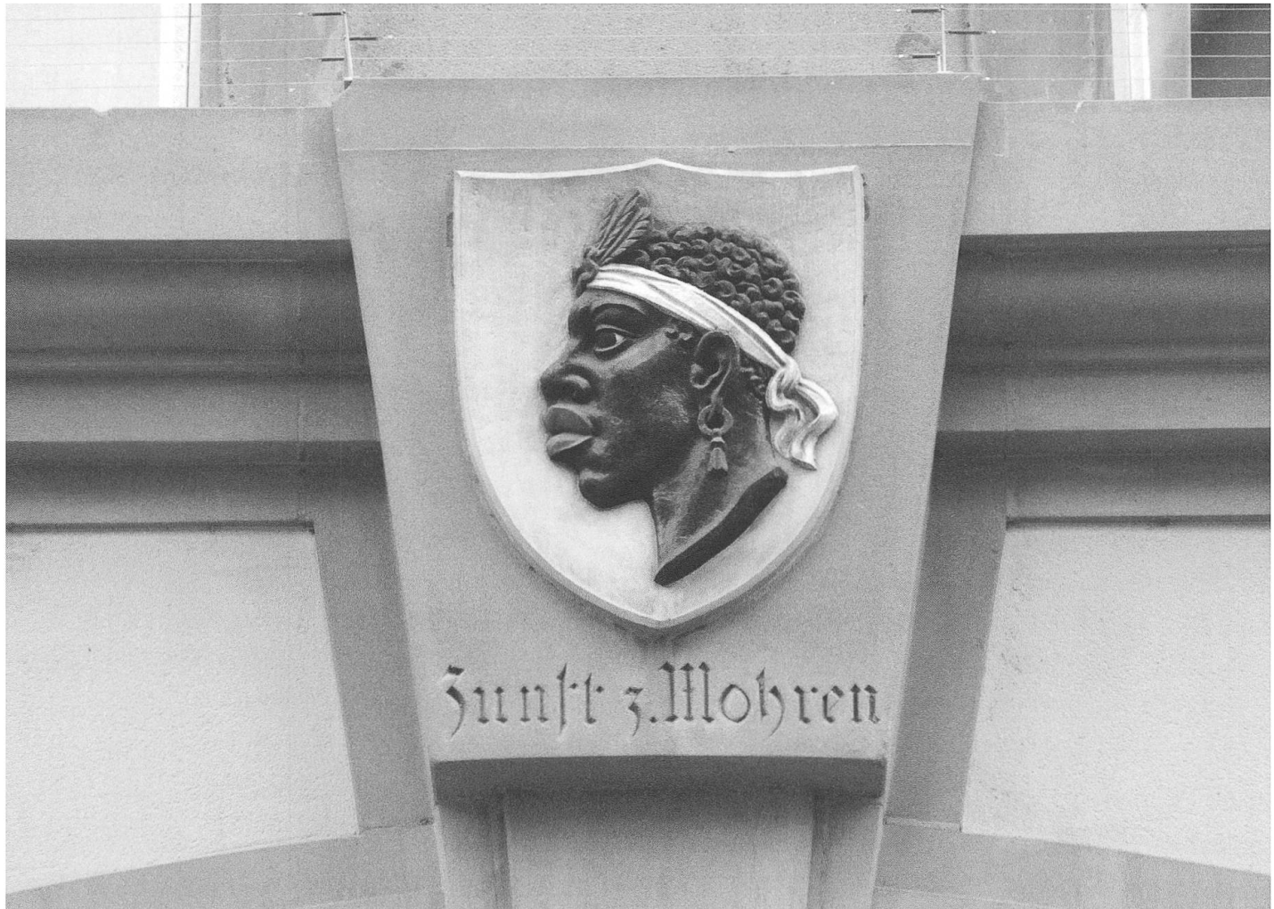
Wappen der Zunft zum Mohren: Afrikaner mit weisser Haarbinde, goldenen Ohrringen und breiten roten Lippen (vermutlich Anfang 20. Jahrhundert). Rückseite des Zunfthauses zum Mohren, Rathausgasse 9.