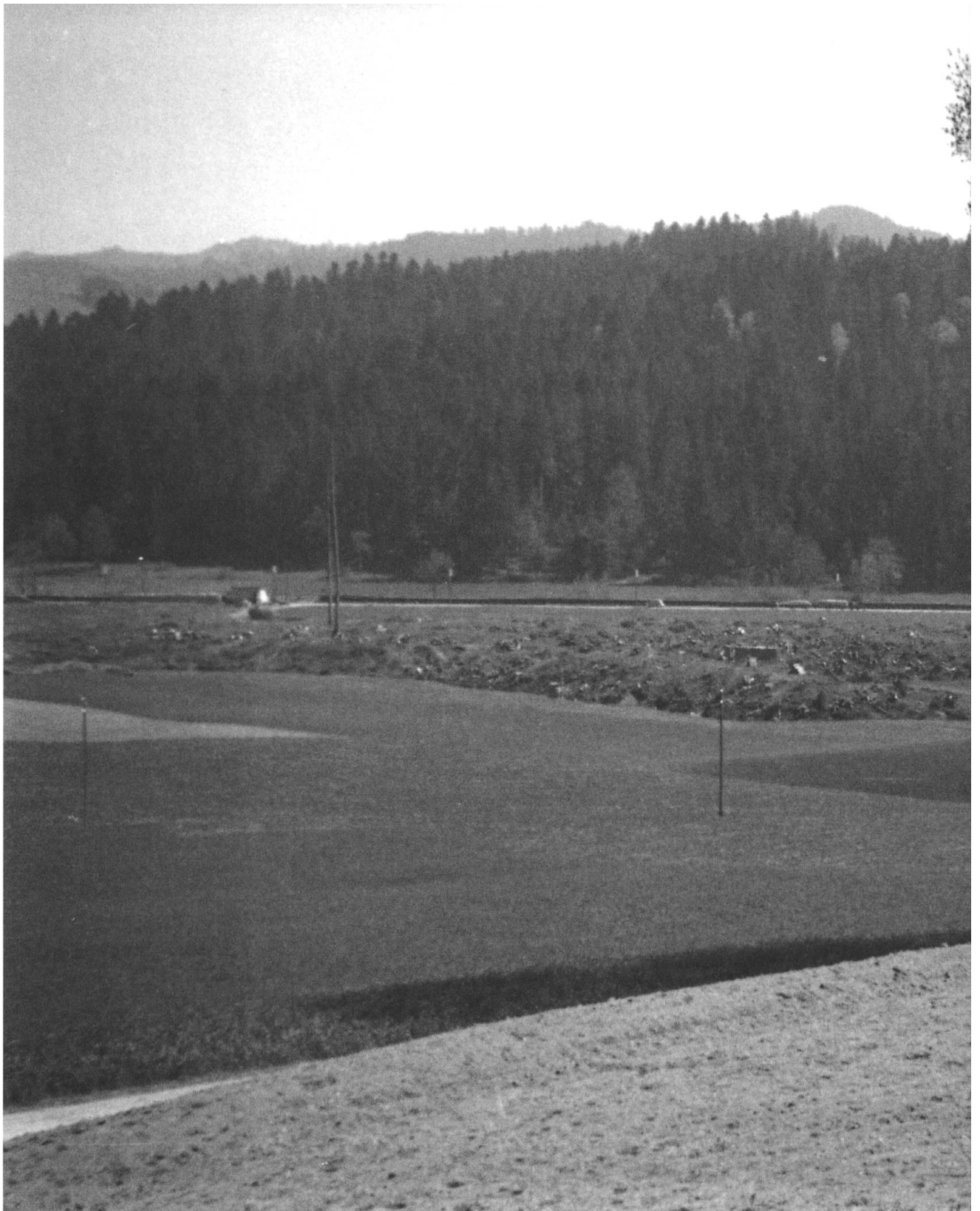
Rodungsfläche des Kühwaldes, Gemeinde Dürrenroth, Mai 1944. Während der Anbauschlacht konnten kleinere Rodungen durch die Waldeigentümer selbst durchgeführt werden, grössere Rodungsarbeiten wurden an Bauunternehmer vergeben. Die Rodung des Kühwaldes übernahm das Baugeschäft Reinhardt & Cie. in Sumiswald. Die Holzverwertung organisierten die Waldeigentümer. Das Holz konnte an Ort und Stelle auf die Bahn verladen und abtransportiert werden.