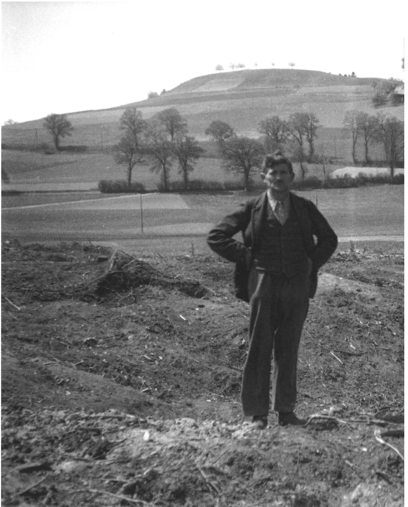
Rodung Kühwald Dürrenroth, Mai 1944. Rodungsfläche nach dem Entfernen der Wurzelstöcke. Nach einer gründlichen Säuberung der Fläche durch Hilfsmannschaften musste der Boden mit einem Bagger planiert werden, bevor er unter den Pflug genommen werden konnte.