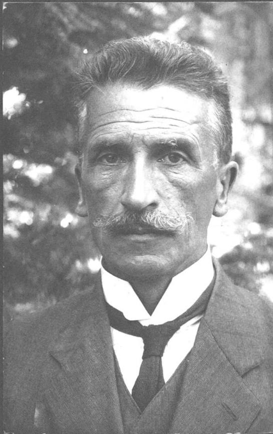
Aufnahme von Stadtpräsident Gustav Müller aus dem Fotoalbum von Robert Grimm.