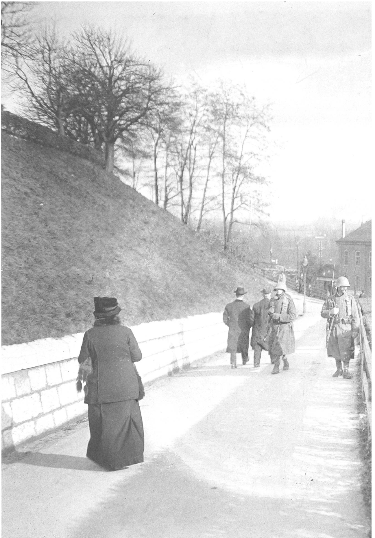
Armeepatrouille auf der Grossen Schanze oberhalb des bestreikten Bahnhofs.