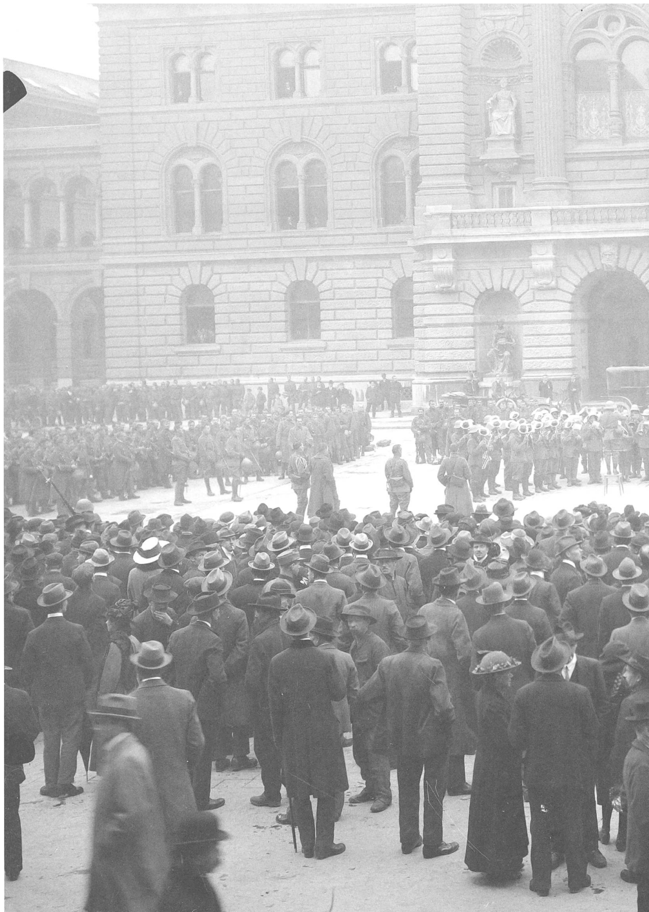
Konzert des Spiels des Freiburger Infanterieregiments 7 zur Sessionseröffnung auf dem Bundesplatz, 12. November 1918. Eine von mehreren bürgerlichen Gegendemonstrationen, die während des Streiks in der Stadt Bern stattfanden. – Schweizerisches Bundesarchiv E27#1000/721#14095#5455*.