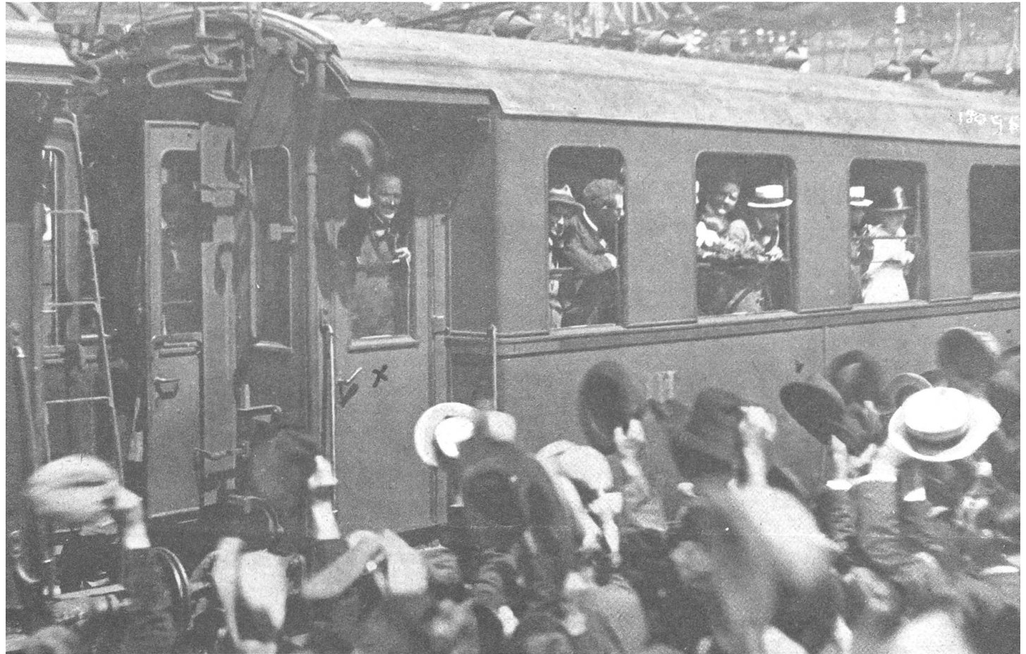
Robert Grimm (im Türfenster) verabschiedet sich am 7. Juli 1919 am Bahnhof Bern von seinen Anhängern, um seine Haftstrafe auf Schloss Blankenburg anzutreten. – Schweizer Illustrierte Zeitung Nr. 29 (19.7.1919), S. 401