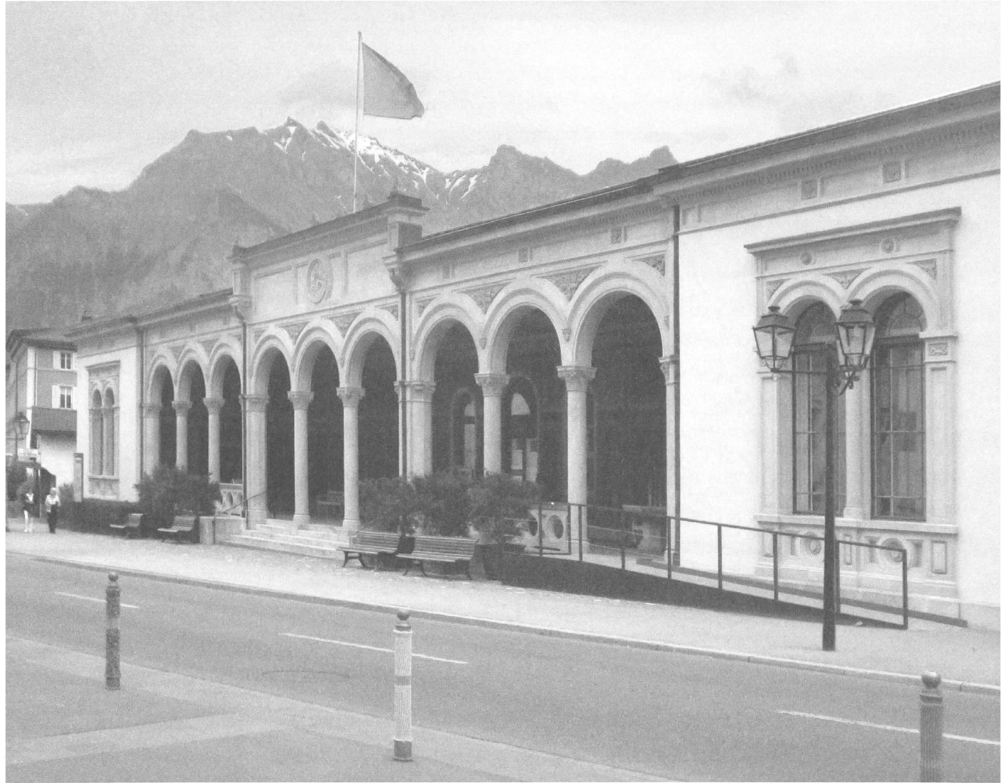
Das 1866/67 errichtete «Dorfbad» in Bad Ragaz ist als einziges traditionelles Badehaus der Schweiz noch bis heute in Betrieb. – Foto: Fred Kaspar 2012.