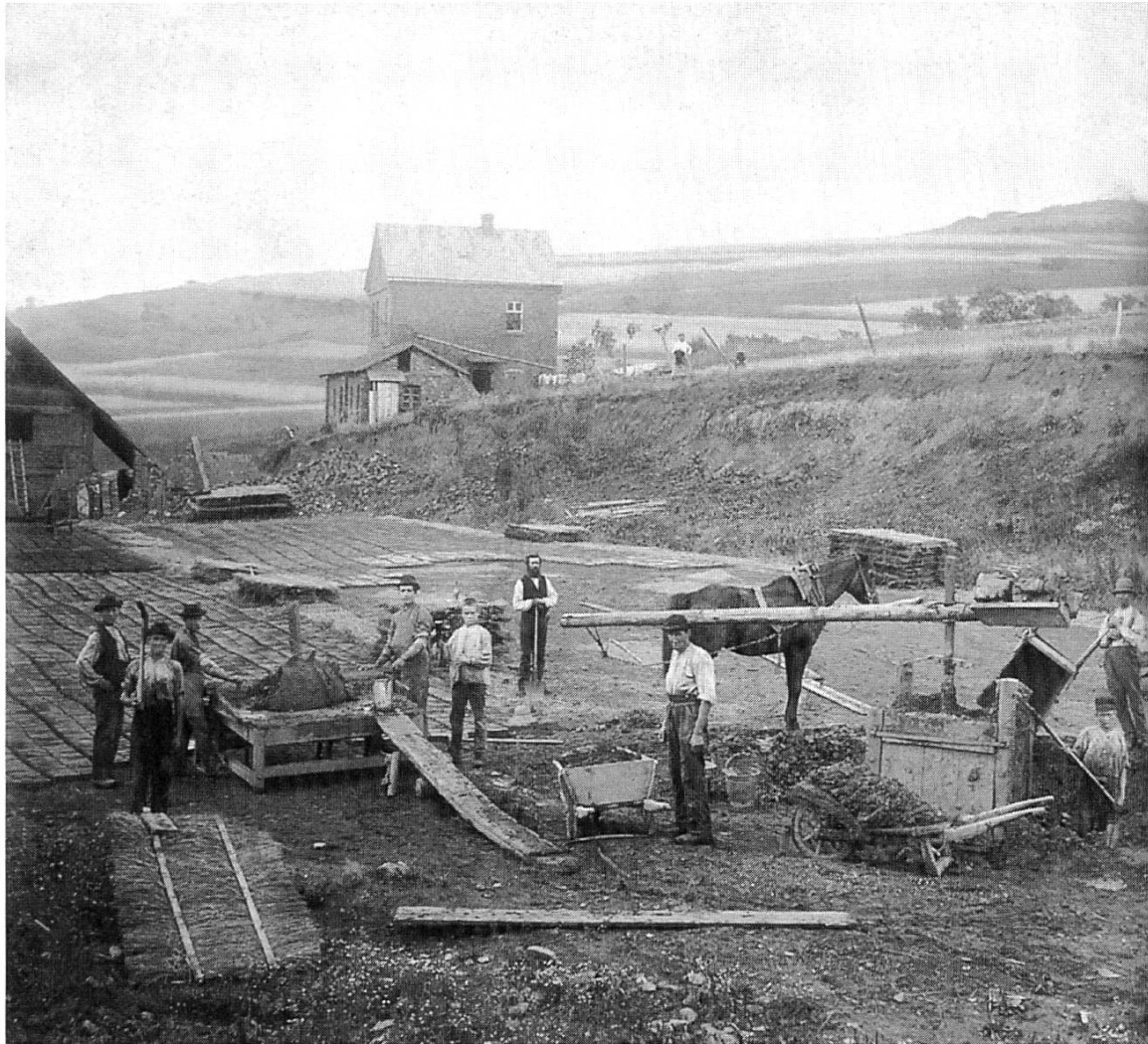
Wanderziegler aus Lippe auf einer Handstrichziegelei bei Göttingen, um 1890.

Anfang des 19. Jahrhunderts erkannte der Fürst zu Lippe den Nutzen der Wanderarbeit für sein Land und für sein Budget, denn durch den Verdienst der Ziegler kam im Herbst viel Geld ins Land. 1854 waren es immerhin 283 760 Reichstaler. Und mit zunehmendem Wohlstand wuchs beispielsweise auch die Baulust und schuf neue Arbeitsplätze im Land.