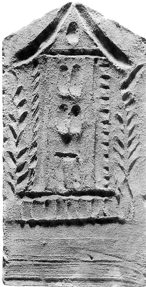
Ziegel mit Turmdarstellung vom Schloss Neu-Bechburg, Oensingen SO, wohl 19. Jahrhundert. Der Randstrich wird zum Hausdach. Reg.-Nr. 6632, zur Ansicht von Heinz Studer, Oensingen.

Die laufenden Geschäfte verliefen positiv und erforderten keine Zusammenkünfte des Gesamtrates.