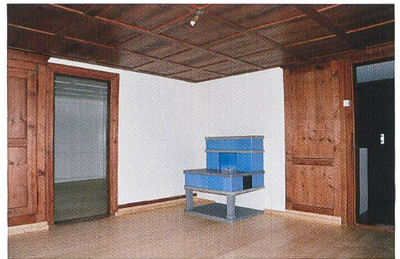
Abb. 4: Zieglerhaus, 1. OG, Stube.

Das Zieglerhaus war vor und ist nach der Renovation in einem Zustand, bei dem Veränderungen und Zufügungen zum ursprünglichen das Gesamtgebilde ausmachen. Die Eingriffstiefe wurde in der jüngsten Episode weniger von funktionalen Bedürfnissen bestimmt, sondern ergab sich aus den Anforderungen des Brandschutzes, welche neue Abschlüsse und Verkleidungen für die bestimmten Brandabschnitte verlangten. Die Feuerungsanlagen wie Holzherde, Neben- und Kachelofen wurden instand gestellt, Stuben und Zimmer aufgefrischt, ein Bad für die Wohnung eingebaut. Das Äussere wurde einer Überholung unterzogen und mit einem Unterstand ergängt.