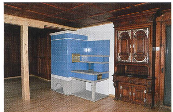
Abb. 7: Zieglerhaus, EG, Stube / Büro.