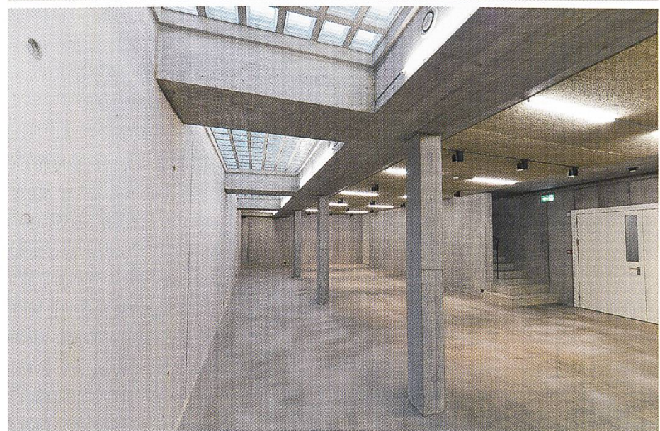
Abb. 1–3 OG, Dauerausstellung EG, Eingang und Treppenhäuser UG, Wechselausstellung