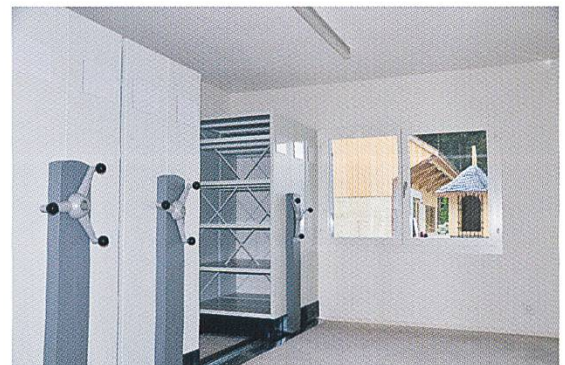
Abb. 6: Zieglerhaus, EG, Bibliothek.