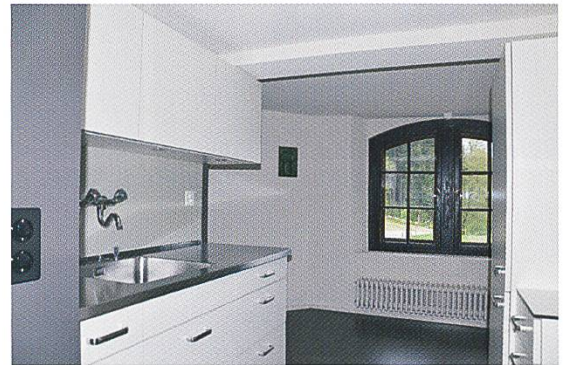
Abb. 5: Zieglerhaus, 1. OG, Küche.