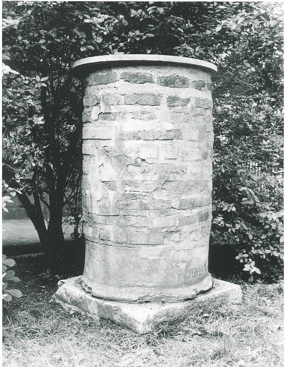
Abb. 1 Aachen, Katschhof: Basis und Ziegelsäulenstumpf vor 1943.