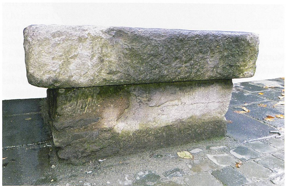
Abb. 2 Aachen: Plinthe der Säule auf dem Katschhof, nördlich des heutigen Domes in Aachen. Die links beschädigte und nur im rechten Bereich original erhaltene Plinthe ist durch eine grössere moderne Platte abgedeckt.