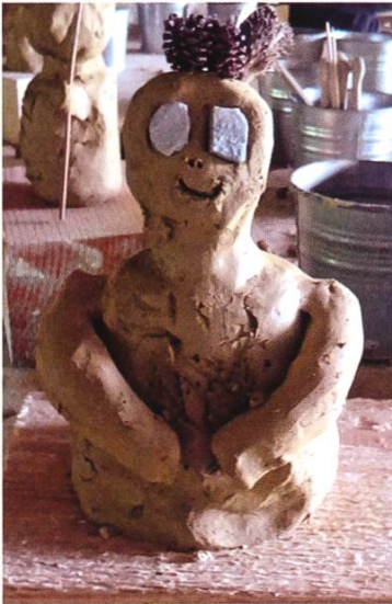
Die Lehmfigur entstand im Rahmen des Kooperationsprojekts mit dem Kunsthaus Zug.