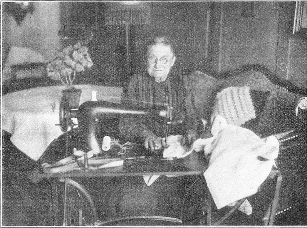
85jährige Näherin. — Lingère de 85 ans.

arbeit abgeliefert. Viele verlieren im Laufe der Jahre ihre geistigen Kräfte. So strickte ein altes 80jähriges Fraueli längere Zeit Socken für die Arbeitsstelle und kam jede Woche regelmäßig mit ihrer Arbeit, immer eine der Ersten. Die Socken waren gut gestrickt, nur war es nicht möglich, der Frau beizubringen, daß die Menschheit auf „großem Fuße“ lebe und ihre Socken für den gewöhnlichen Bedarf zu klein seien. Es wurde alles Mögliche versucht, um Abhilfe zu schaffen, vergebens! „Gänd mer doch z'Lisme, daß mer's Läbe nüd verleidet“, so bat sie, und die Arbeitsstelle hat ihr zu stricken gegeben und hat bis heute noch eine Anzahl dieser kleinen wollenen Socken, die nur ganz selten verlangt werden.