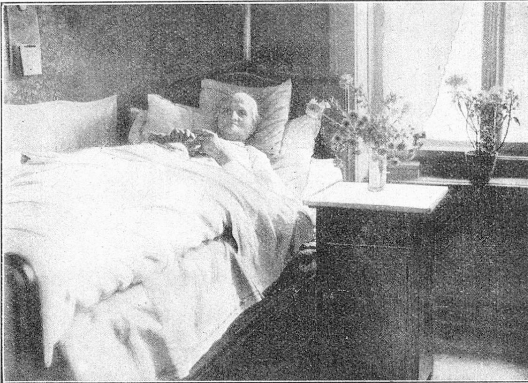
Gelähmte alte Strickerin. — Vieille tricoteuse percluse.

Armenpflege, denen sie die noch arbeitsfähigen und arbeitswilligen alten und gebrechlichen Leutchen abnimmt. Sie sollen keine Almosen, die sie gar nicht verlangen, sondern Arbeit erhalten. Die Zahl der jetzt Arbeitenden ist auf 70 im Jahr gestiegen. Ein großer Teil sind alte Leute, denen die Jahre die Arbeitskraft gebrochen haben. Es werden gegenwärtig beschäftigt: