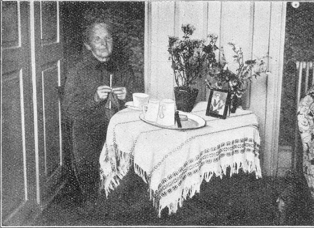
78jährige Strickerin. — Tricoteuse de 78 ans.

Daß ein „Geschäft“ wie die Arbeitsstelle für Gebrechliche nicht rentabel sein kann, ist einleuchtend, aber der ethische Wert dieser Art Unterstützung ist nicht hoch genug einzuschätzen und rechtfertigt durchaus jedes Opfer, das dafür aufgebracht werden muß. Je mehr die Arbeitsstelle unterstützt wird, je mehr Anstalten, Vereine und Private ihren Bedarf bei ihr decken, desto mehr Arbeiter und Arbeiterinnen kann sie beschäftigen und dadurch ihren Wirkungskreis erweitern.