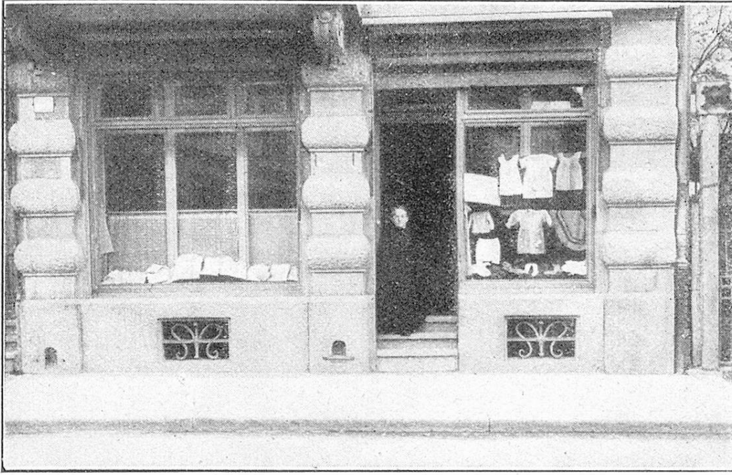
Geschäftslokal der Arbeitsstelle. — Magasin de l'„Arbeitsstelle“.

eigenes Geschick machte es ihr möglich, immer mehr Arbeitsgelegenheiten und Absatzmöglichkeiten in den Dienst der guten Sache zu stellen. Hilswillige setzten sie in Stand, für diesen gemeinnützigen Betrieb ein eigenes Geschäftslokal zu mieten.