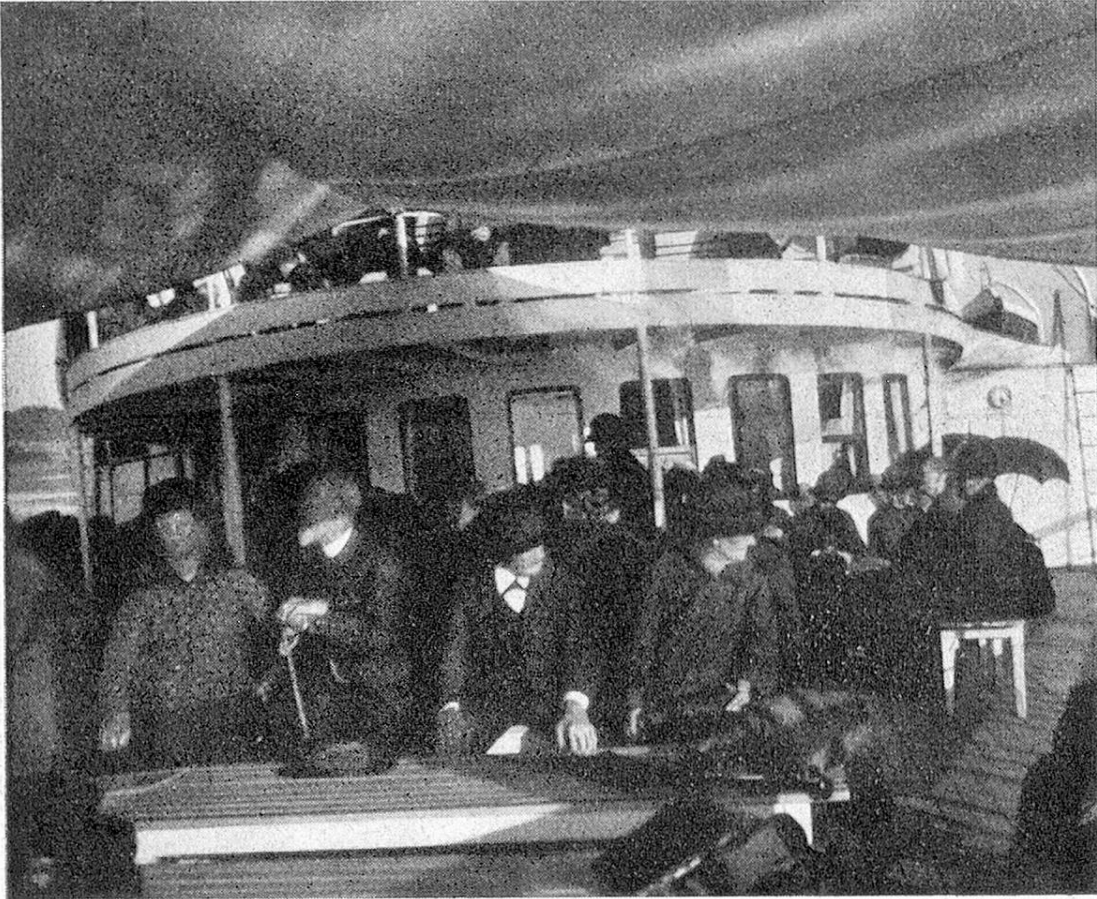
Auf dem Schiff der Alten — Sur le bateau des vieux.

Da — horch! — bricht fröhlicher Sang aus frischen Mädchenkehlen, in welchen vereinzelte zitternde Stimmen einfallen, und ein helles Leuchten geht über die runzeligen Gesichter. Freude lebt auf dem Schiff der Alten, farbenfroh flattern die vaterländischen Fahnen im Winde, strahlend blau wölbt sich der Augusthimmel über den grünen,