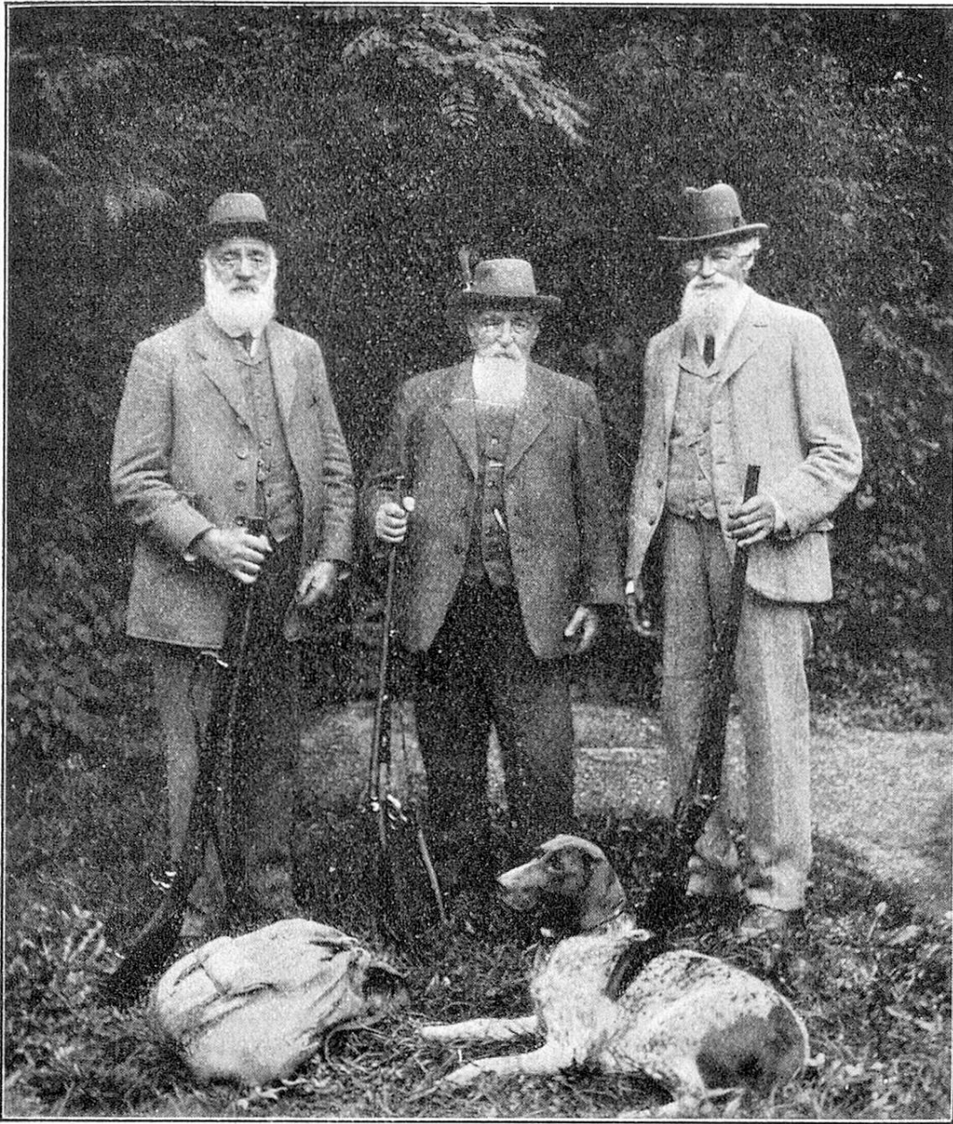
Die drei ältesten Bündner Jäger — Les trois chasseurs grisons les plus âgés.