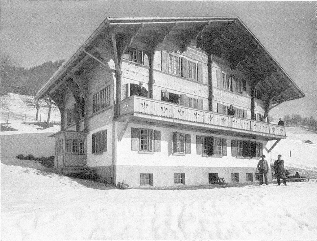
Gesamtansicht des Altersheims Saanen.