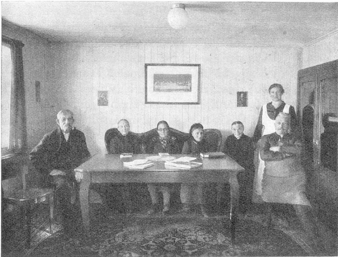
Die ersten Insassen in der guten Stube.

von 14 m. Von der Laube aus, wie überhaupt aus jedem Südfenster, genießt man einen weiten, freien Blick über den zirka 30 m tiefer liegenden, 3 km langen Talboden zwischen Saanen und Gstaad und auf die dahinter ansteigenden Berge des Saanenlandes: Hornberg, Gifferhorn, Wasserngrat, Wildhorn, Windspillen, Spitzhorn, Eggli. Gegen Westen erblickt das Auge über den 300 m entfernten, mächtigen Kirchturm der 1444 erbauten Kirche von Saanen die trotzigen Felsen der Dorfflühe, das steil aufschießende Rüblihorn und in der Ferne den Rocher de Naye und die Berge des benachbarten, waadtländischen Pays d'Enhaut.