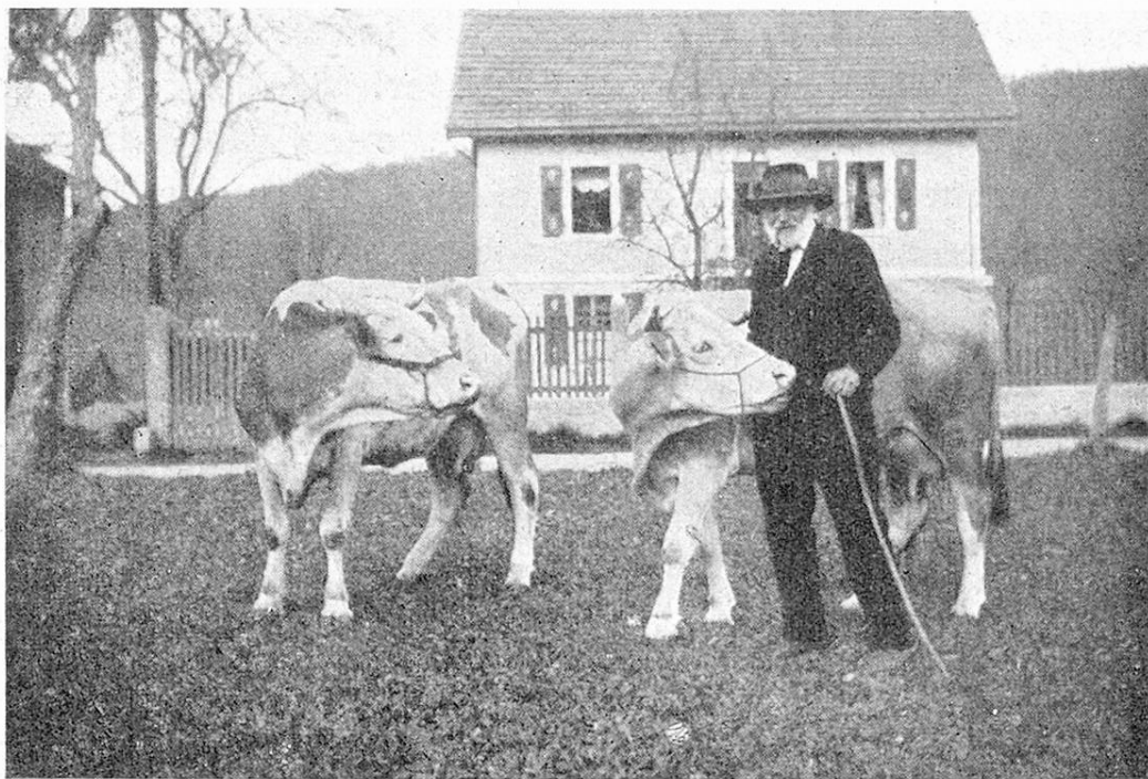
M. Buchwalder avec ses vaches.

Nous nous représentons aisément combien fut pénible une vie pleine de labeur, dépourvue de confort, loin de toute communication et dans une région montagneuse. Seuls les habitués des travaux de la campagne comprendront le courage, la persévérance qu'il faut pour travailler dans de semblables conditions. Des glissements de terrain faillirent emporter sa maison et d'autres épreuves encore ne lui furent pas ménagées. Ils eut six enfants dont les survivants font la joie de ses vieux jours.