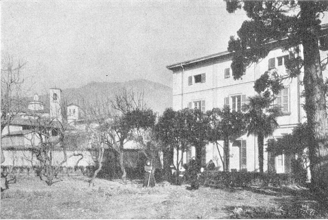
Il Ricovero S. Rocco visto dal giardino.

Nel mese di ottobre dell'anno 1935 si faceva una fondazione: la casa Catenazzi veniva acquistata, e il Ricovero aperto.