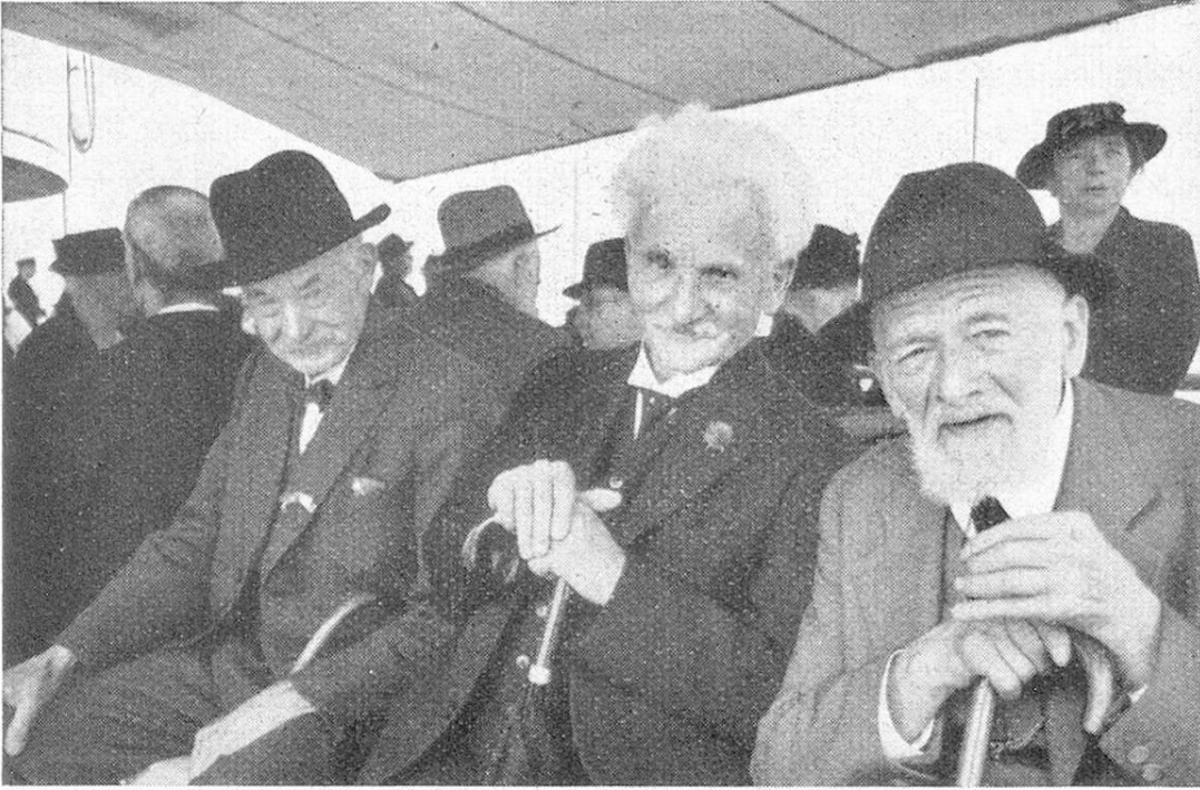
Zufriedene Teilnehmer an Bord der „Stadt Rapperswil“.

soliden Beinen steht, macht es sich in den schönen, schattigen Hafenanlagen bequem. Die meisten durchstreifen das heimelige Städtlein. Viele erklimmen den Stadthügel mit dem Polenschloß und der alten Stadtkirche und genießen die wunderbare Aussicht. Auf einer nahen Bank sitzt ein altes Paar und diskutiert lebhaft. „Rapperswil isch würklich e Perle im St. Gallerland“, meint der Mann. „En Chabis“, — sagt die Frau — „Rapperswil isch am Zürisee und ghört zu Züri.“ Flötentöne unterbrechen den heitern Disput.