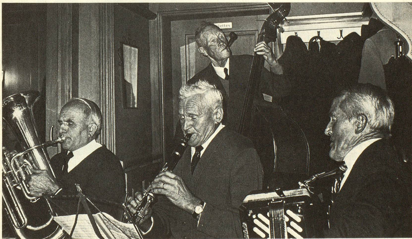
Die Stöckler-Musik aus Hemberg spielt auf.

Da es mein Ziel ist, dass auch Ergotherapeutinnen und Pflegerinnen mit den Patien-