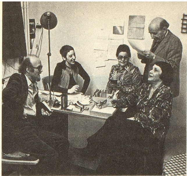
Bei der Teamsitzung der «Seniorenbühne» scheint es lebhaft zuzugehen (die Namen sind dem Text zu entnehmen).

Der letzte Raum gehört der «Seniorenbühne». Hier ist eine lebenslustige und gut