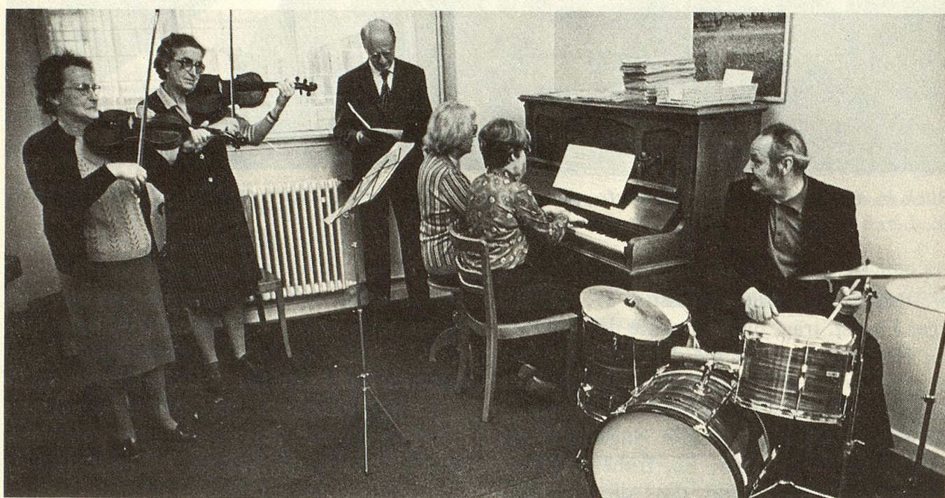
Probe im Musikzimmer (Namen im untenstehenden Text).