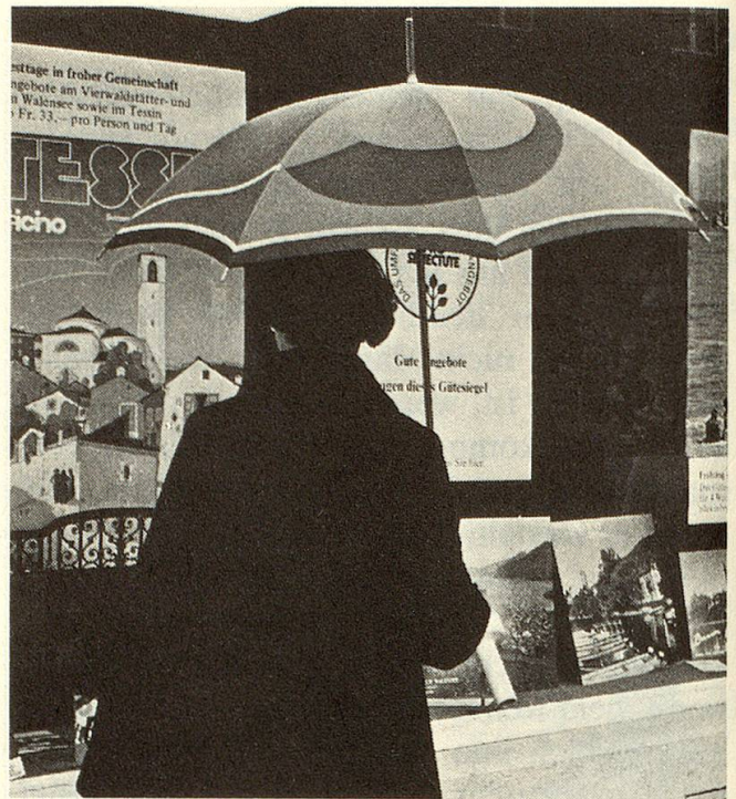
Eines der Schaufenster an der Forchstrasse 127.

Wir betreten das Lokal, stehen Grossaufnahmen fröhlicher Senioren gegenüber, sehen in der Sitzecke Herrn Lerch in eifrigem Gespräch mit einer Kundin, dahinter ein Gestell voller Ferienprospekte. Ein grosser Tisch ist mit Drucksachen aller Art beladen. Da sind alle Publikationen, Prospekte und Zirkulare von Pro Senectute zu finden. Hier