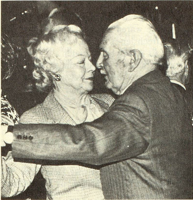
Mit typisch welschem Schwung dreht sich dieses Paar zur nostalgischen Musik.