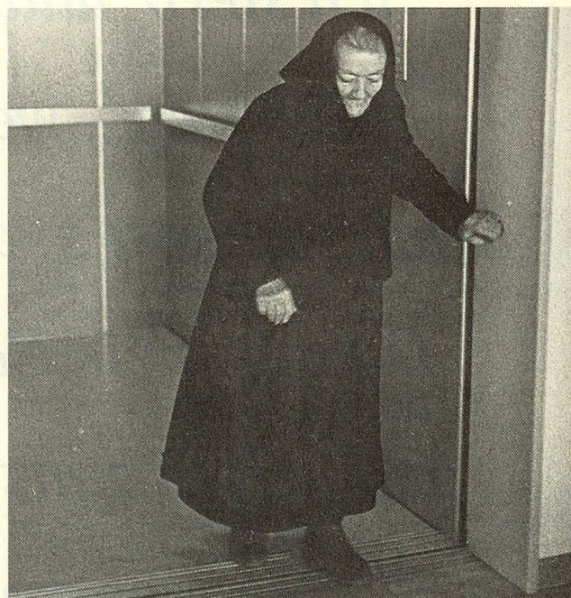
Eine Walliserin findet sich im Altersheim mit dem «neumodischen» Lift ab.

Ich freue mich über diese neue Aufgabe, älteren Menschen noch in aller Stille beistehen zu können. Frau F. K. in Z.