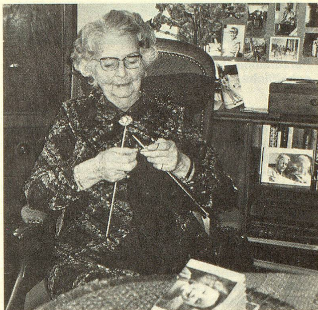
Zufrieden inmitten von Andenken.

Eigentlich komisch, dass für allzu viele Menschen die Worte: «Alterssiedlung, Alterswohnheim, Altersheim» einen so erschreckenden Beiklang haben, als ob es dort nur nach Staub und Moder röche, als ob man mit dem Eintritt auf alles neue Erleben, auf einen persönlichen Lebensstil völlig verzichten müsste! Dabei ist dies keineswegs der Fall, das Leben pulsiert auch hier weiter, freilich nicht mehr in so hektischem Rhythmus.