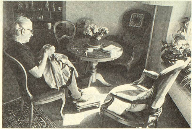
Die Alterswohnung einer Schwester der Schweizerischen Pflegerinnenschule in Zürich.

Seit 11 Jahren wohne ich in einer Alterssiedlung und habe es noch nie bereut. Ich kann soviel Schönes unternehmen und mich auch mit allen meinen Liebhabereien befassen. Meine Freizeit ist stark ausgefüllt mit Musizier- und Handarbeitsnachmittagen, aber auch zur Betreuung von Kranken und Behinderten im Hause. Es gibt so viel zu tun, wenn man zum Helfen bereit ist und sich nicht absondert. Gewiss ist es nicht immer leicht mit den Altersgenossen. Jedes hat seinen eigenen Kopf und seine Lebenserfahrung. Das alles zu verstehen und abzuhören braucht viel Geduld und Liebe.