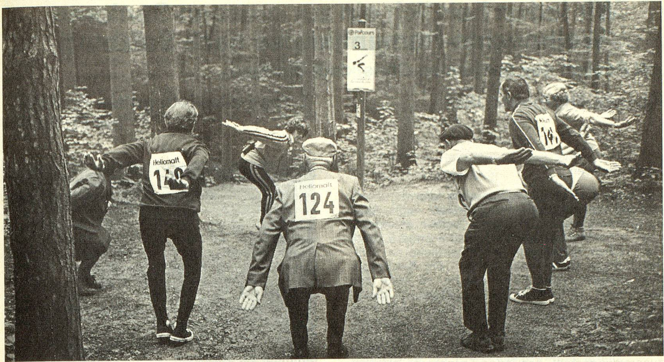
Obwohl das Vorbild beim Vita-Parcours nicht erreicht wird, ist das Mitmachen gesund.