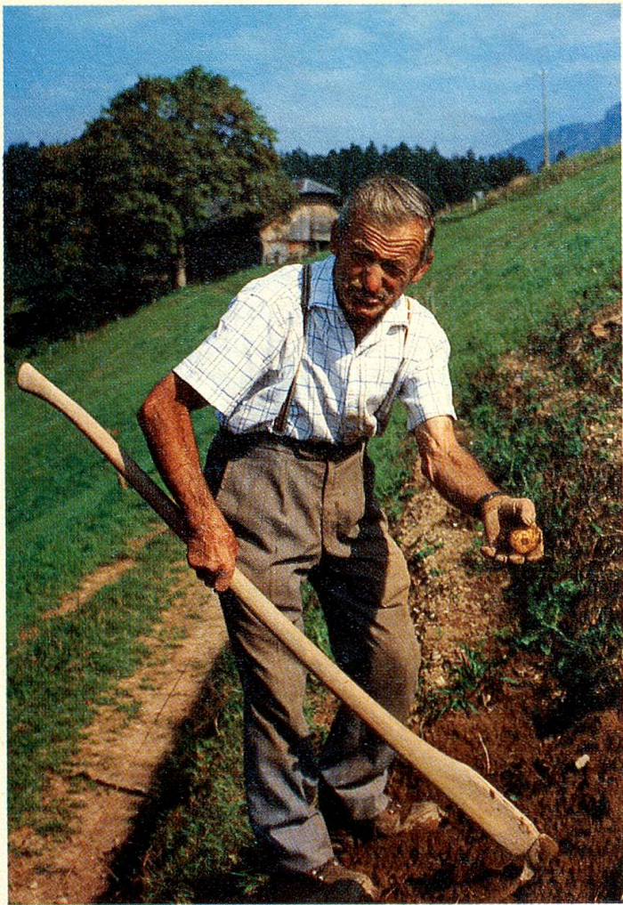
An schönen Herbsttagen ist die Kartoffelernte am Hang noch zu erledigen. Die Tierhaltung ist aufgegeben, der Stall leer. Dafür wird die Blumenpracht vor dem Stall mit umso grösserer Liebe gepflegt.