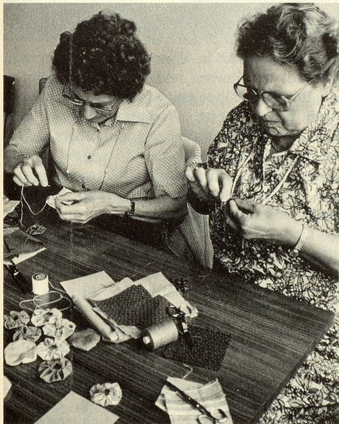
Zum Ferienseminar gehörte auch der beliebte Werkunterricht : Hier werden Rosetten aus Stoffresten genäht.

Wieder wurden die acht Tage unter ein Thema gestellt, diesmal hiess es: « Sterben und Tod und das Leben nach dem Leben ». Anfangs trafen die Anmeldungen nur zögernd ein — war das Thema zu «heiss»? Eine bisherige Teilnehmerin schrieb ab: «Ich möchte zwar gerne kommen, doch bin ich eher für lustig . . .». Am Seminar waren es dann aber gegen sechzig ältere Menschen, die ein Gespräch über Leben und Sterben nicht scheuten.