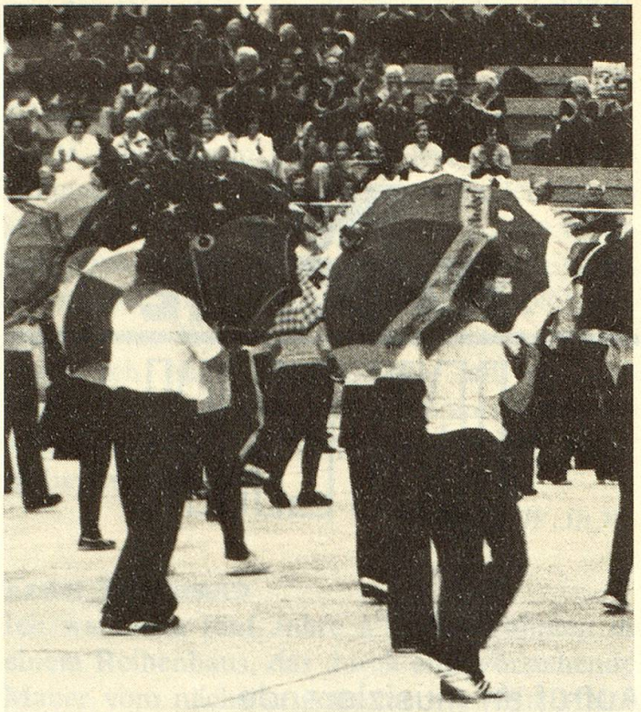
Ein fröhlicher «Schirmtanz» in Kreuzlingen.

Am Bodensee beeindruckte das harmonische Zusammenspiel der verschiedenen Gruppen. Ob «Familienfeier» ob Volksfest, beide Anlässe überzeugten, dass die vielbelächelten Anfänge überwunden sind und das Turnen zu einem wichtigen Bestandteil eines «aktiven Alters» geworden ist.