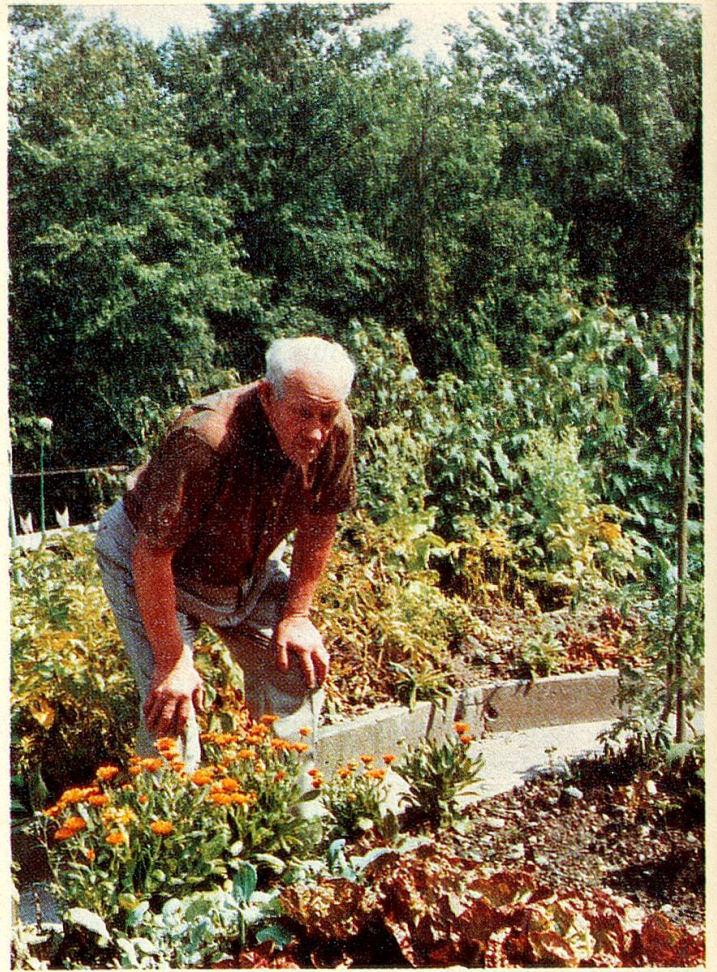
Inspektion im Garten: Ob die neue Salatsorte wohl gedeiht?