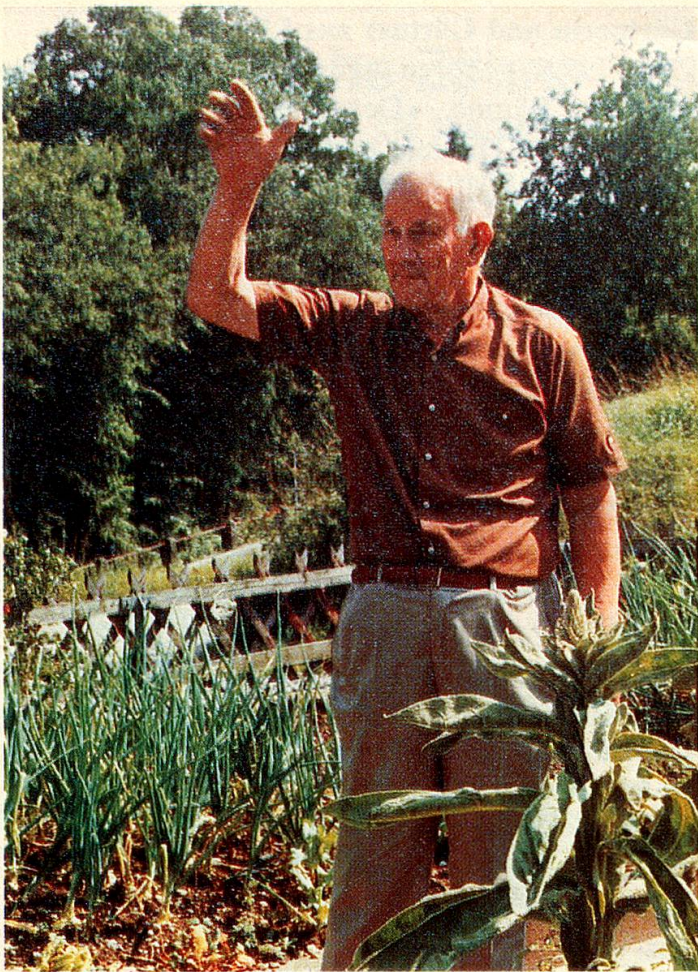
Ein freundlicher Abschiedsgruss für einen lang-jährigen Kunden.