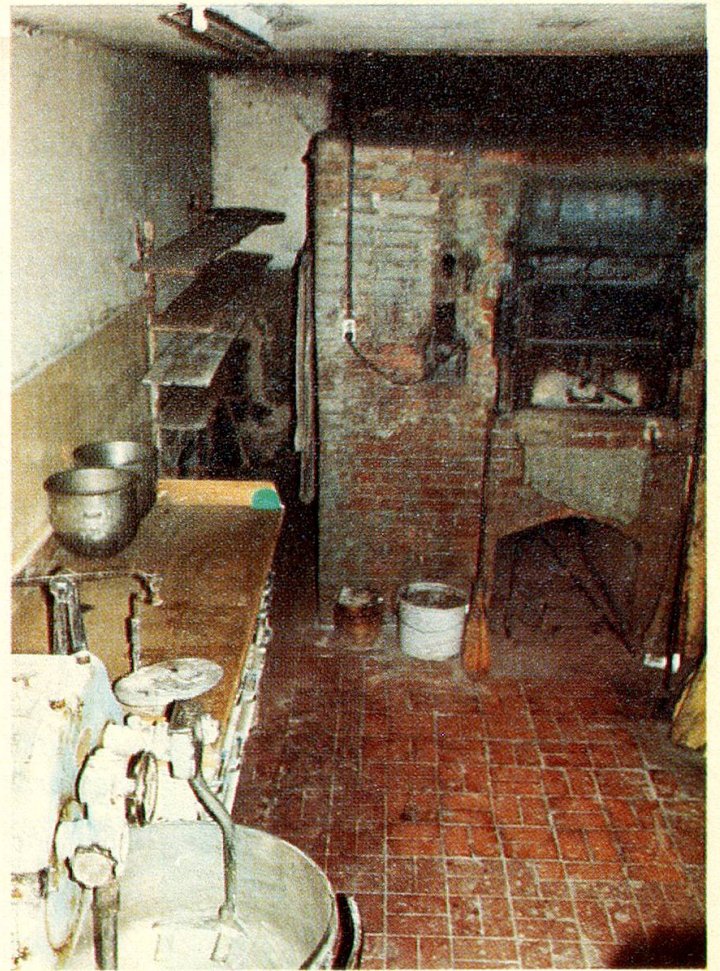
Eine blankgeputzte Knetmaschine, ein erloschener Ofen; am Nachmittag herrscht hier Ruhe.

Nur noch wenige der schmackhaften Brote warten auf Käufer, einige Laibe sind schon bestellt.