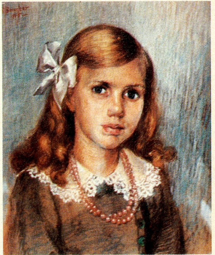
Das Porträt der Zehnjährigen hat die Mutter mit Waschen und Bügeln abverdient.

Diese entzückende Obstschale im Jugendstil begeistert jeden Besucher.