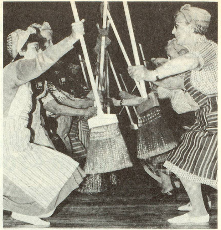
Die Turngruppe Dussnang beim Besentanz.