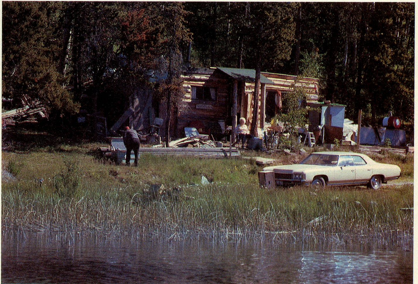
Das Blockhaus am Silbersee ist Elisabeth Hunzingers Sommerwohnung geworden.