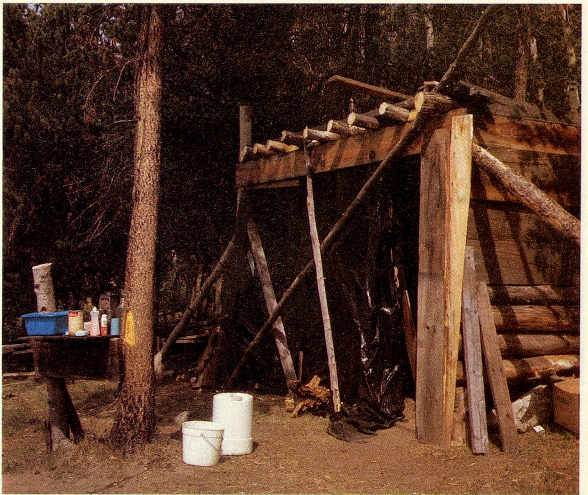
Das Blockhaus im Aufbau. Noch sind viele Stunden anstrengender Arbeit nötig, bis es wohnlich wird.